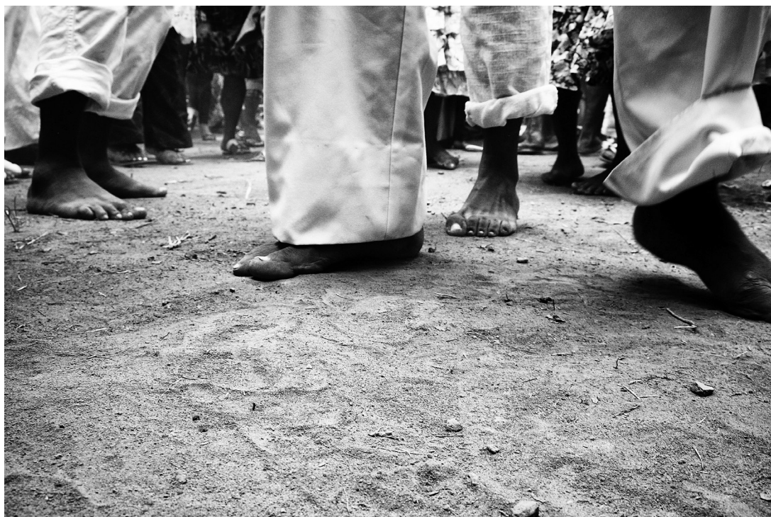
1. Detalhe dos pés descalços dos juremeiros em contato com a terra.