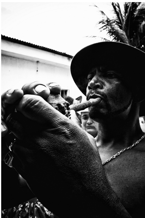
4. Uma entidade Malunguinho prepara seu charuto para jogar a fumaça sagrada para o alto.