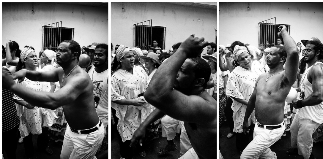
2. Sequência de imagens demonstrando a dança de uma entidade Malunguinho com seus típicos movimentos de braços e corpo.