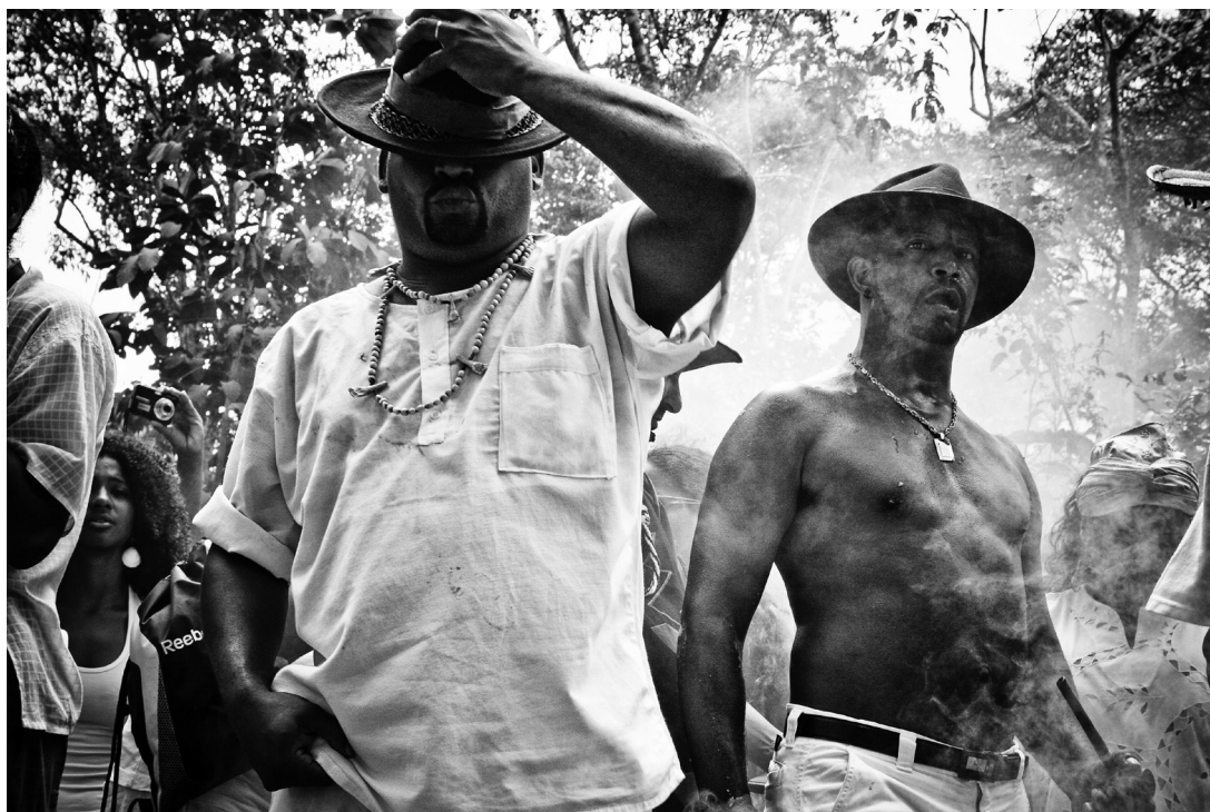
7. Dois mestres da jurema envolvidos pela fumaça dos defumadores e dos cachimbos.