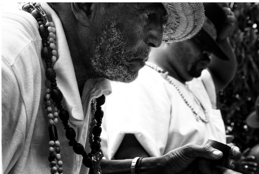
3. Dois juremeiros incorporam entidades da jurema. O chapéu, as guias e os cachimbos são elementos bastante presentes nas cerimônias.