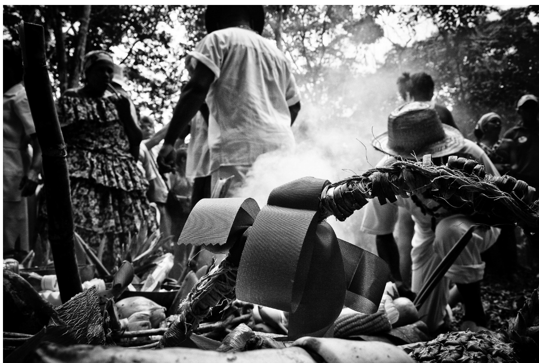
5. As cestas com oferendas de frutas e os defumadores são arranjados na mata como altares. No detalhe, duas fitas com as cores de Malunguinho.