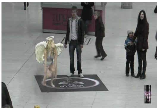
Figura 9: Frames do filme demonstrativo da ação de Link . Minutagem: 0:21'67"

Na figura 4, observamos um rapaz (passante da estação Vitória) assumir um lugar na área demarcada no chão pela marca Link e, por isso, automaticamente ser capturado para uma interação caracterizada por um fa-zer conjunto e que produz um discurso que se constrói em ato. Nesse ponto, o destinatário se voluntaria para participar do programa narrativo da interação estabelecida pela marca anunciante – é o que o caracteriza como narratário.