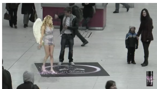
Figura 12: Frames do filme demonstrativo da ação de Link que demarcam o mesmo momento da situação semiótica pela imagem enunciada no telão

Dito de outra forma, como o interlocutor se vê na tela da situação analisada – não como uma simples projeção , que lhe facultaria se ter como um ele , mas como uma extensão de si promulgada pela máquina que o captura e leva uma parte dele (inclusive que o afeta esteticamente) para o telão – a multibreagem actancial se dá de forma enunciativa. Dessa forma, as simultaneidades da categoria de pessoa acabam sendo uma condição inexorável da qual os indivíduos capturados são (mesmo que sem o perceber) incapazes de se desvencilhar.