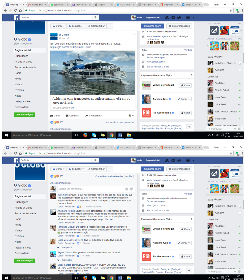
Figura 1: Printscreen da tela do Facebook da página O Globo ( https://www.facebook.com/jornaloglobo/ ). Acesso em: 24/8/2017

sua própria uma notícia. Com alguns cliques, o leitor “curte” e publica, com ou sem comentários, a notícia em seu mural da rede social, revelando seu modo de pensar e exercitando concretamente sua competência de co-enunciador. Veja-se exemplo (cf. Figura 1) recente transcrito da página da rede social facebook do jornal O Globo :