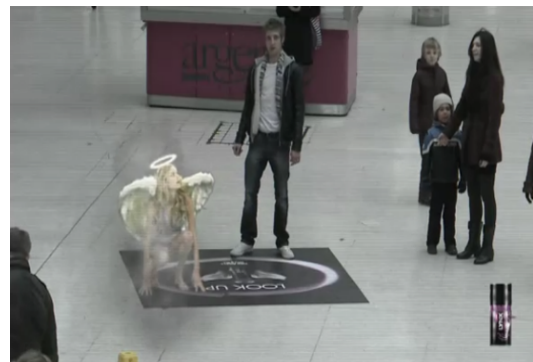
Figura 7: Frames do filme demonstrativo da ação de Link . Minutagem: 0:20'73”