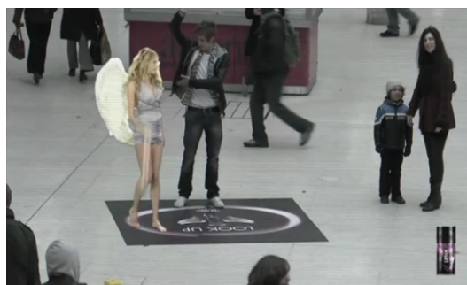
Figura 11: Frames do filme demonstrativo da ação de Linx . Minutagem: 0:27'00”

Observemos as figuras 10 e 11: ao realizar os movimentos e gesticular com o tronco, cabeça e, principalmente, com os braços, o rapaz desloca sua atenção da dimensão física para a virtual, passando do concreto ao representado, tanto quanto opera ao contrário, tudo