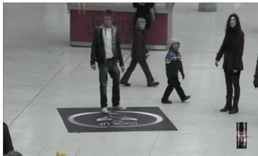
Figura 4: Frames do filme demonstrativo da ação de Link . Minutagem: 0:18'83”

Chamamos essa operação de “multibreagem”. Ela consiste na operação de projeções sucessivas das categorias enunciativas de pessoa, tempo e espaço, alternando debreagens e embreagens, em curtíssimo espaço de tempo. O efeito de sentido decorrente dessa operação discursiva é o de uma impossibilidade de delimitar quando o sujeito se encontra debreado ou embreado em relação ao enunciado, o que corrobora o caráter multifacetado e o aspecto contínuo das situações semióticas que envolvem a tecnologia digital da RA.