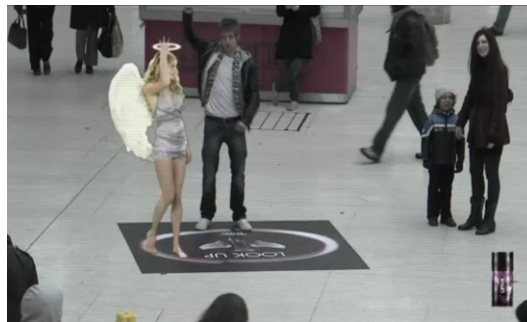
Figura 10: Frames do filme demonstrativo da ação de Linx . Minutagem: 0:26'33”

Repensando Benveniste (1976, p. 45), vemos o corpo fenomenológico do “rapaz” do caso que analisamos como um “operador semiótico complexo” de “múltiplas facetas”, que agora é potencializado pela tecnologia de RA (que amplia as possibilidades sensíveis do corpo) e produz uma semiótica que conecta e articula os universos concreto e virtual, alargando as possibilidades de instalação da pessoa no enunciado.