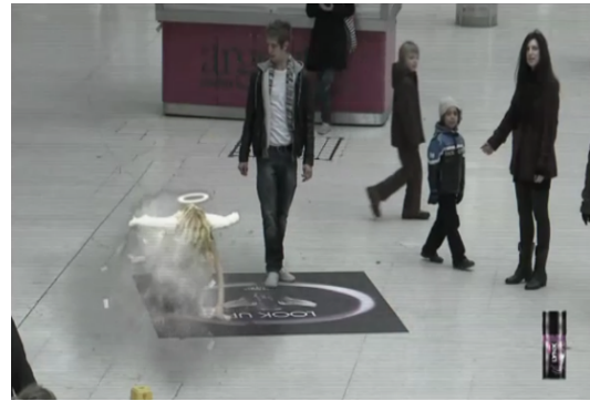
Figura 6: Frames do filme demonstrativo da ação de Link . Minutagem: 0:19'57”