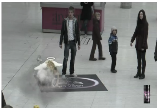
Figura 5: Frames do filme demonstrativo da ação de Link . Minutagem: 0:19'33”