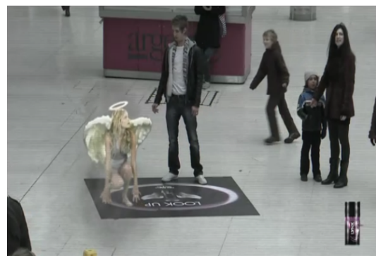
Figura 8: Frames do filme demonstrativo da ação de Link . Minutagem: 0:21'17”