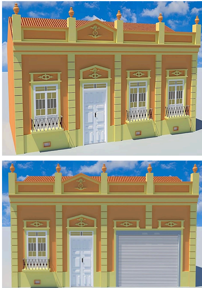
Figura 3: Modelo ilustrativo de um processo de descaracterização, por meio de análise comparativa. Em cima: uma edificação do estilo Eclético, considerada como íntegra; embaixo: a mesma edificação com um processo de descaracterização.

Apesar disso, a primeira descrição acerca da descaracterização arquitetônica, é feita pelo Programa de Preservação do Núcleo Histórico de Paracatu (1984), cujo considera que edificações com descaracterização, são aquelas que passaram por reformas que alteraram às características originais, onde, muitas vezes, por meio de novas intervenções, é possível retornar às características originais (TURKIENICZ; MALTA, 1986). Desta forma, se considera que a descaracterização representa a perda das características e a sua nomenclatura, não tem a intenção de desqualificar o imóvel, mas sim, mensurar a sua preservação (Figura 3).