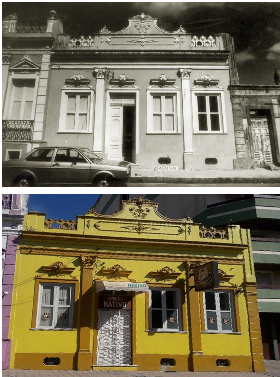
Figura 7: Exemplo de análise comparativa, de imóvel de tipologia Corredor Central, denominado “Corredor Central-03” e classificado no método com grau I; em 1987 (em cima), e em 2018 (embaixo).

Já no grau I, foram inseridas boa parte das edificações da amostragem e, todas somaram entre 1,1 a 3,0 pontos. Neste grau, nas 10 edificações enquadradas, ainda constam edificações com ótima preservação, no entanto, com maior incidência de descaracterizações leves, porém, não tão invasivas a ponto de afetar a leitura da obra. Conforme a ilustra a análise comparativa da Figura 7, foi identificado a presença de três elementos descaracterizantes, sendo a: inserção de toldo, grades e aparato publicitário.