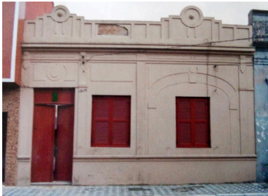
Figura 8: Exemplo de análise comparativa, de imóvel de tipologia Corredor Lateral, denominado "Corredor Lateral-01" e classificado no método com grau II; em 1987 (em cima), e em 2018 (embaixo).

No grau III, somente 3 edificações somaram entre 5,1 a 6,9 pontos e foram inseridas neste grau. Diferente dos anteriores, nestes imóveis, já é possível verificar a presença de descaracterizações leves, médias e também graves, que podem afetar diretamente na arquitetura da obra. O quarto exemplo (Figura 9), apresenta as descaracterizações de uma edificação de tipologia corredor lateral, onde foram identificadas a substituição de telha original por telha fibrocimento (material diferente), abertura de vãos, substituição de esquadrias com alteração na verticalidade e horizontalidade, variação nos elementos em massa e a presença de elementos descaracterizantes, como toldos e aparato publicitário.