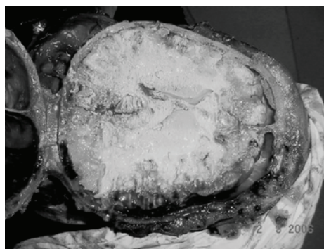
Figura 2. Hematoma subdural em região parieto-temporal direita.