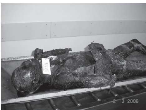
Figura 1. Corpo com carbonização parcial