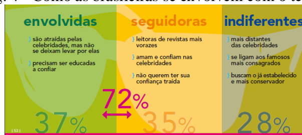
Fig. 4 - Como as brasileiras se envolvem com o tema.

De forma mais ampla, a segmentação nos revelou que, utilizando uma figura famosa em uma campanha publicitária, apenas 28% das mulheres sentem-se mais distantes desse universo, enquanto 72% delas estão envolvidas com o tema.