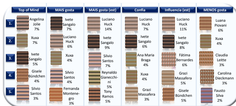
Fig. 3 - Celebidades apontadas pelas consumidoras brasileiras - Ranking Top 5

As descobertas da pesquisa também foram alicerçadas pelo agrupamento das consumidoras a partir dos seus níveis de envolvimento com o consumo de celebridades. Assim, segmentamos o mercado considerando como as consumidoras definem a influência que os famosos têm sobre seu comportamento e como relacionam celebridades com publicidades e marcas. Categorizamos tais envolvimento a partir de três grupos: as “envolvidas”, as “seguidoras” e as “indiferentes”, conforme o quadro a seguir: