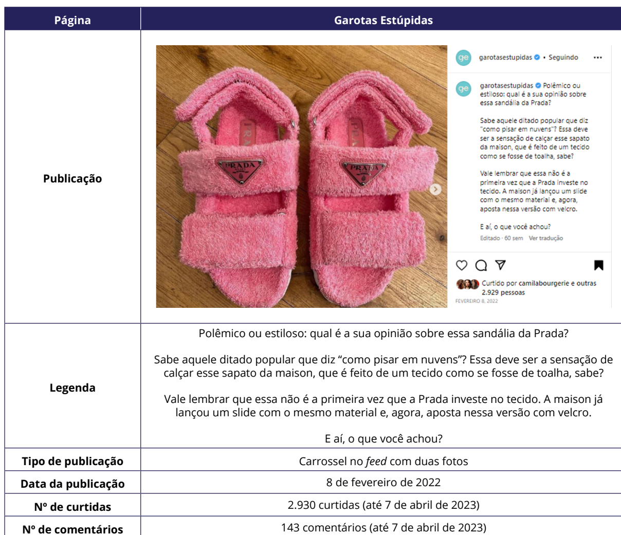
Quadro 3 – Post 1: GE