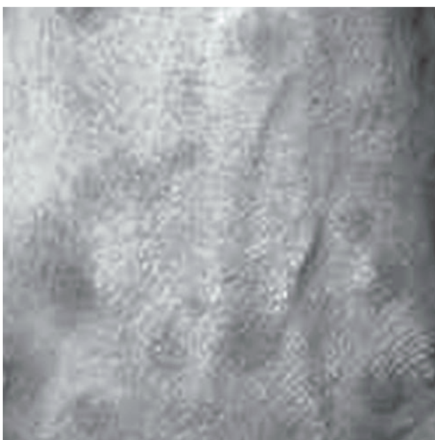
Figura 2. Lesões cutâneas em alvo, localizadas em região palmar. Apresentadas por paciente em uso de ziprasidona.

reações graves, tais como o eritema multiforme, são passíveis de ocorrência (Warnock e Morris, 2002).