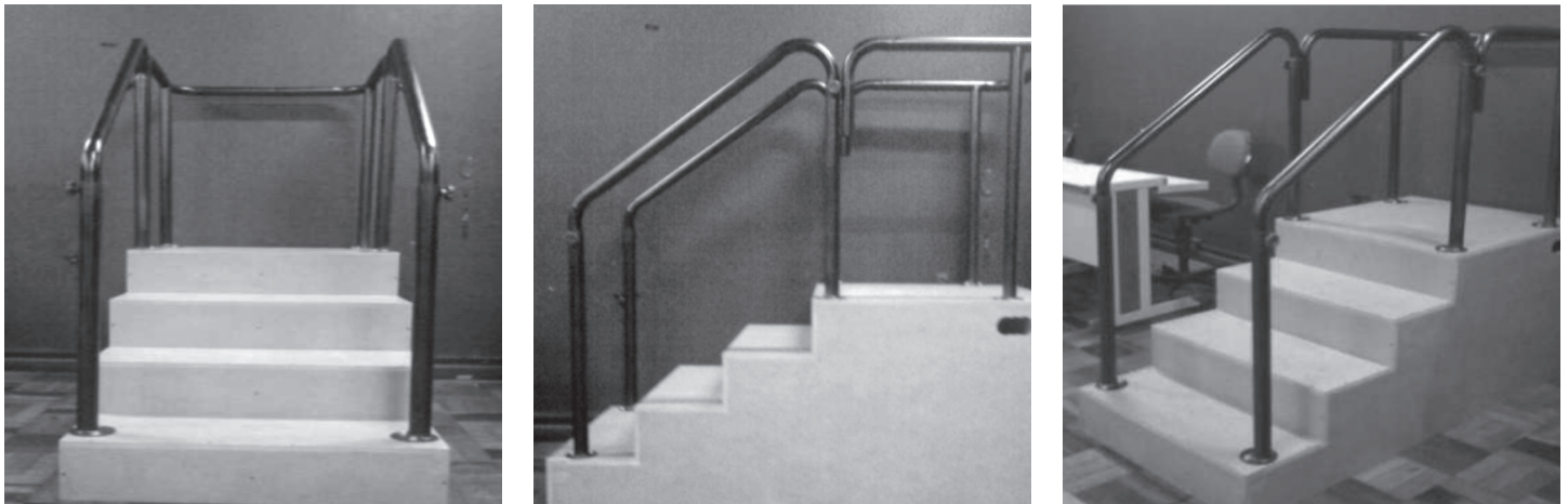
Figura 1 – Escada de madeira utilizada neste estudo

o teste com sapato habitual e com seu usual dispositivo auxiliar de marcha. O tempo despendido para realização do teste é interpretado da seguinte forma: 1) Menor que 10 segundos: totalmente independente; 2) Menor que 20 segundos: independente para as principais transferências, caminha sem auxílio mecânico ou com bengala, capaz de subir escadas sem auxílio; 3) Entre 20 e 29 segundos: grande variabilidade do nível de equilíbrio, da velocidade de marcha e da capacidade funcional; 4) Maior ou igual a 30 segundos: necessita de auxílio para as transferências e para deambular sobre as escadas e terrenos irregulares. 25,26