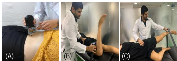
Figura 2. Compressão de pontos-gatilho com o aparelho algômetro, quadrante inferior esquerdo da coluna lombar (A); Posicionamento do paciente durante a dinamometria do glúteo máximo (esquerda) (B) e do glúteo médio (direita) (C)

Os participantes que apresentaram pontos-gatilho foram submetidos a um teste de intensidade da dor através da compressão dos pontos-gatilho em um ângulo de 90° em relação a superfície da coluna lombar com o aparelho algômetro de pressão digital (marca FPI®). Este aparelho consiste em um disco emborrachado de 1cm 2 fixado em um manômetro que exhibe os valores em Kg/cm 2 (Figura 2).