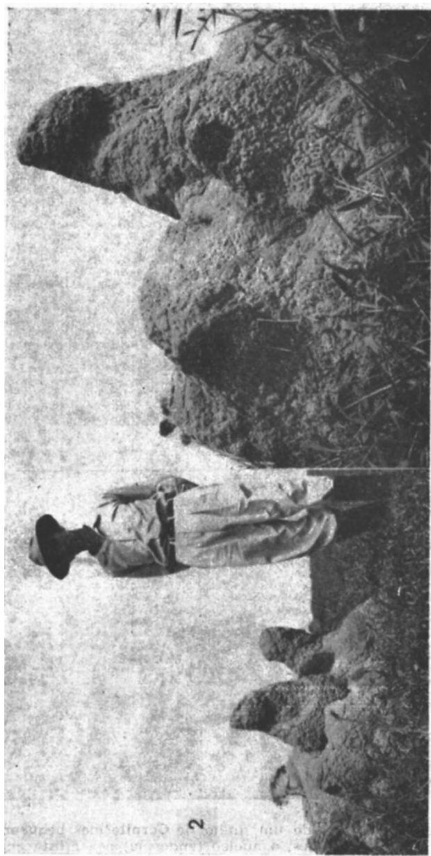
Fig. 2 — Ninho de Cornitermes bequaerti .