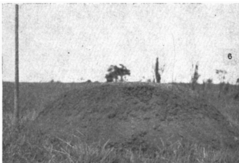
Fig. 6 — Ninho de Syntermes silvestrii (O objeto de referência, à esquerda, mede 1 m de altura).