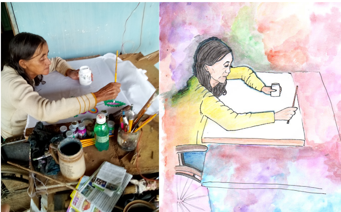
Figura 3 – Fotografia e desenho da própria foto no livro