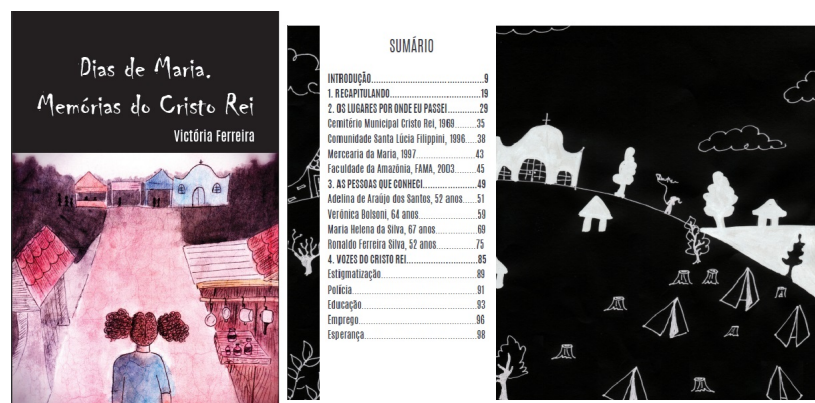
Figura 1 – Capa do livro e sumário ilustrado

Na capa, foi utilizada uma ilustração da autora (ver Figura 1), representando uma menina negra chegando ao bairro, passando pelo cemitério e por uma casa com painéis e remédios à mostra. A personagem da capa caminha por uma avenida e avista ao longe a feira e uma igreja. O desenho tem como objetivo mostrar ao leitor a necessidade de se percorrer um caminho para de fato conhecer o bairro, em suas nuances e faces ainda escondidas do público em geral.