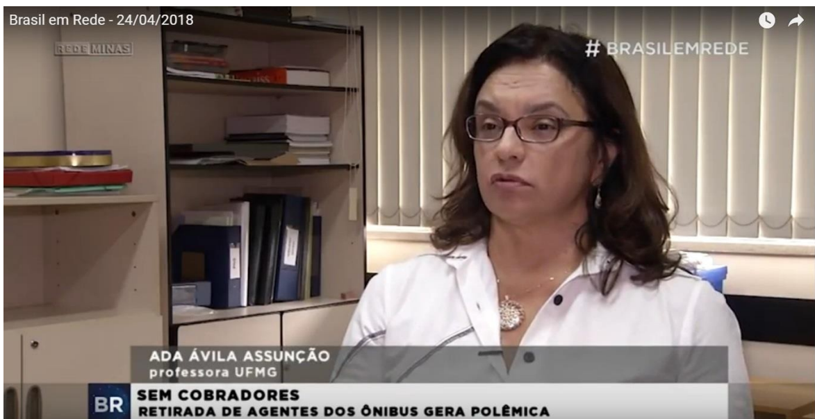
Imagem 1: Edição do dia 24 de abril de 2018 do Brasil em Rede