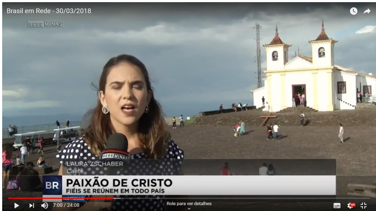
Imagem 2: Edição do dia 30 de março de 2018 do Brasil em Rede