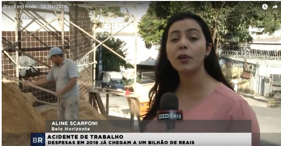
Imagem 4: Edição do dia 28 de abril de 2018 do Brasil em Rede