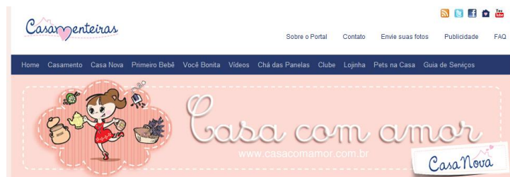
Figura 5: Topo do blog Casa com amor

Na Figura 6 tem-se o topo do blog Primeiro Bebê que trata de temas relacionados à maternidade tais como decoração do quarto do bebê, dicas de enxoval, brinquedos e saúde infantil.