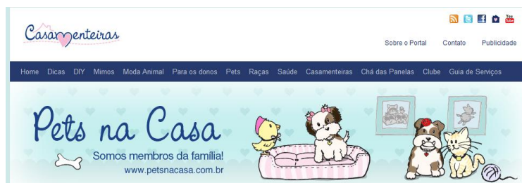
Figura 8: Topo do blog Pets da Casa

Por fim, na Figura 8, apresenta-se o topo do blog Pets na Casa, último blog a integrar o Casamenteiras, que trata de temas relacionados a animais de estimação.