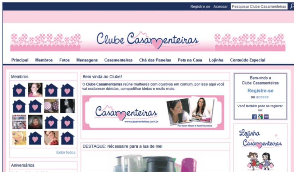
Figura 10: Página inicial do Clube Casamenteiras

leitoras. No Clube, os membros participam ativamente de fóruns, grupos de discussão, atualização de perfil e chat . Trocando experiências, compartilhando fotos e vídeos.