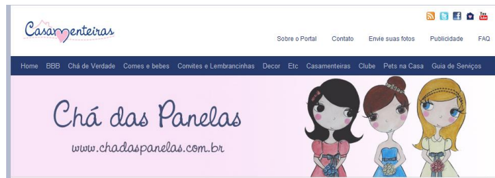
Figura 7: Topo do blog Chá das Panelas

Na Figura 7 mostra-se o topo do blog Chá das Panelas que contém, além de informações sobre como fazer um chá de panelas, posts sobre eventos de verdade, enviados pelas leitoras.