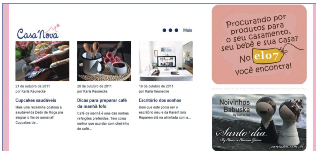
Figura 3: Links para os posts mais atuais da categoria Casa Nova