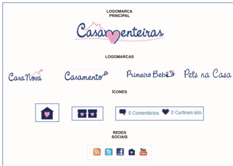
Figura 9: Identidade Visual do Casamenteiras

logomarcas Casamento, Casa Nova, Primeiro Bebê e Pets na Casa - principais temas abordados no portal - são derivadas da logomarca Casamenteiras. Os ícones do Portal Casamenteiras são todos personalizados de acordo com o design visual dos temas apresentados. O Portal possui RSS ( Rich Site Summary ), que é um endereço na Internet que serve para monitorar as novidades do conteúdo do Casamenteiras; Twitter e Facebook (redes sociais); Clube Casamenteiras (rede social personalizada) e YouTube (vídeos).