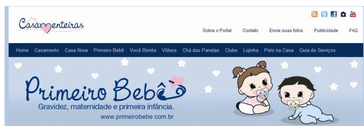
Figura 6: Topo do blog Primeiro Bebê

Na Figura 6 tem-se o topo do blog Primeiro Bebê que trata de temas relacionados à maternidade tais como decoração do quarto do bebê, dicas de enxoval, brinquedos e saúde infantil.