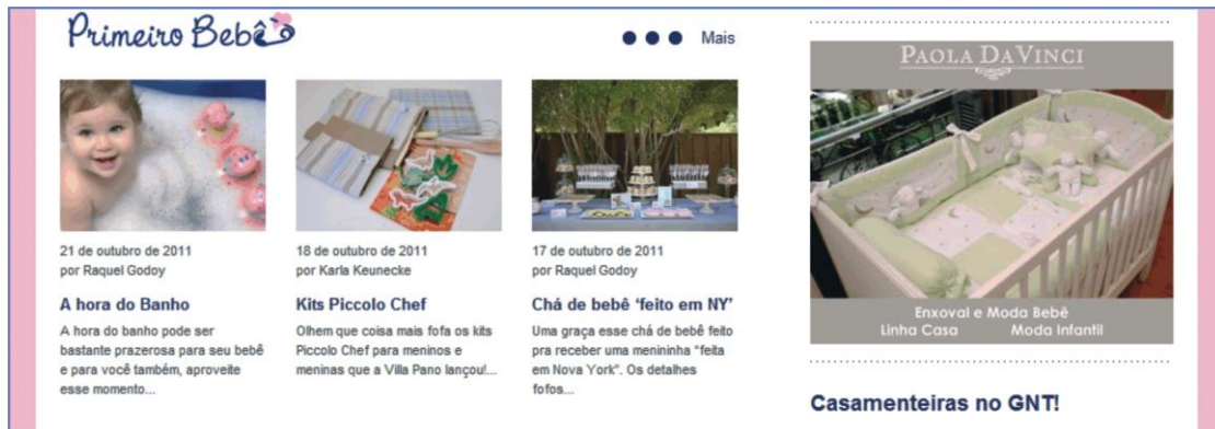
Figura 4: Links para os posts mais atuais da categoria Primeiro Bebê