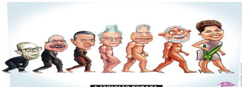
(Fig.4): Charge sobre o Dia Internacional da mulher.