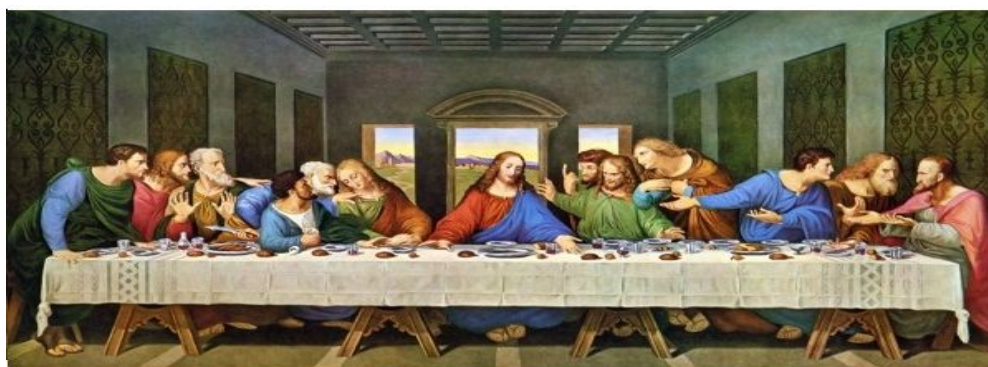
(Fig.1): Última Ceia, de Leonardo da Vinci

19 E os discípulos fizeram como Jesus lhes ordenara, e prepararam a páscoa. 20 E, chegada a tarde, assentou-se à mesa com os doze. 21 E, comendo eles, disse: Em verdade vos digo que um de vós me há de trair. 22 E eles, entristecendo-se muito, começaram cada um a dizer-lhe: Porventura sou eu, SENHOR? (BÍBLIA Sagrada, 1993, p. 592).