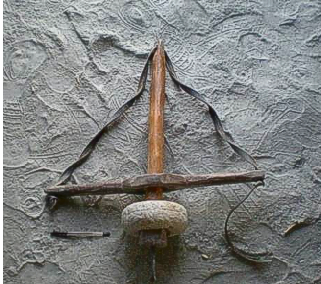
Figura 2 – Puas ou puás.

51. O torno de pedal usado na marcenaria do século XIX e exposto no Museu de Artes e Ofícios em Belo Horizonte (MAO-BH), por exemplo, apesar de não ser hidráulico, tem encaixe parecido com o de pedra-sabão, no qual a peça (madeira) é fixada na horizontal. Ele também conta com o mesmo sistema móvel de adequação ao tamanho da peça, assim como os hidráulicos de pedra-sabão em Cachoeira do Brumado.