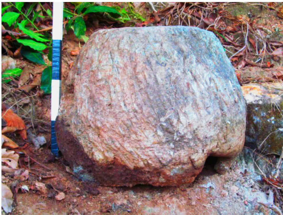
Figura 3 – Ventaneira.

A ventaneira (Figura 3) também teve importante participação na confecção de panelas de pedra-sabão nos séculos passados, mas que atualmente não foi registrado seu uso. Um dos artesãos nos mostrou a ventaneira feita e utilizada por seu falecido pai. 53 Trata-se de uma pré-forma de panela com três orifícios.