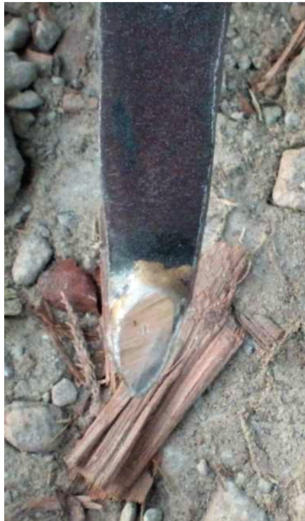
Figura 1 – Ferro de torno.

A alavanca ou o ferro de torno (Figura 1) é uma ferramenta de extrema importância que participa de todo o processo de confecção, desde a coleta de matéria-prima até o acabamento. Por isso, o artesão conta com uma coleção de ferros de torno que têm entre um e um metro e meio de comprimento, com diferentes tipos de ponta em ambas as extremidades.