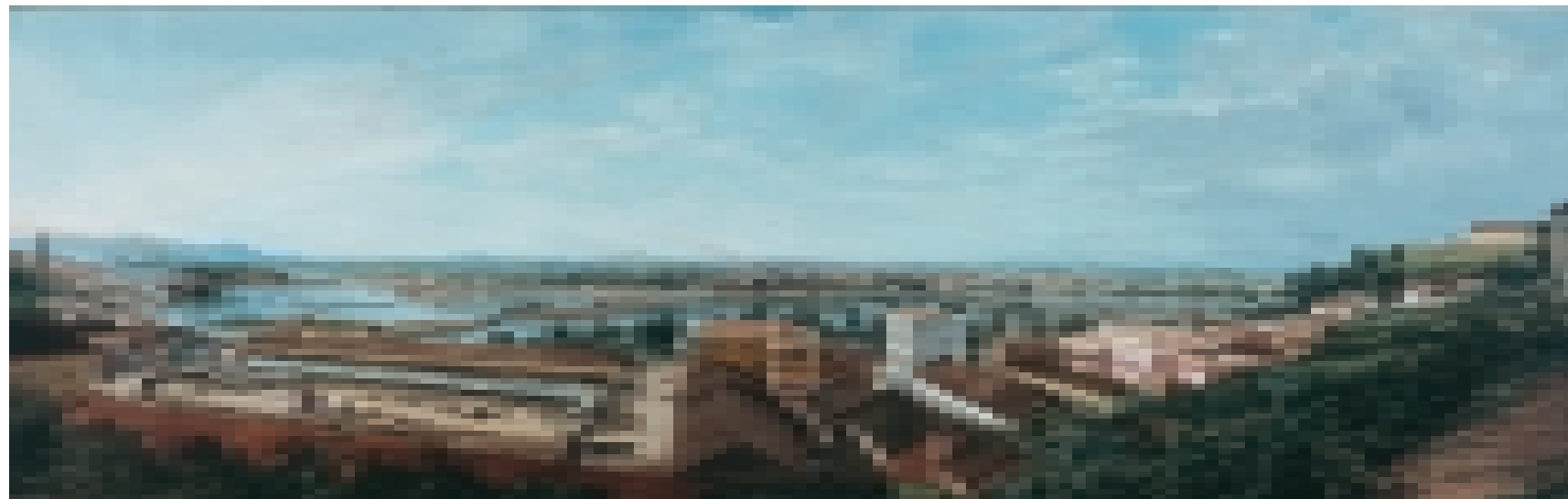
FIGURA 4 – Benedito Calixto. Inundação da Várzea do Carmo, 1892, óleo sobre tela, 125 x 400 cm. Acervo Museu Paulista da USP.