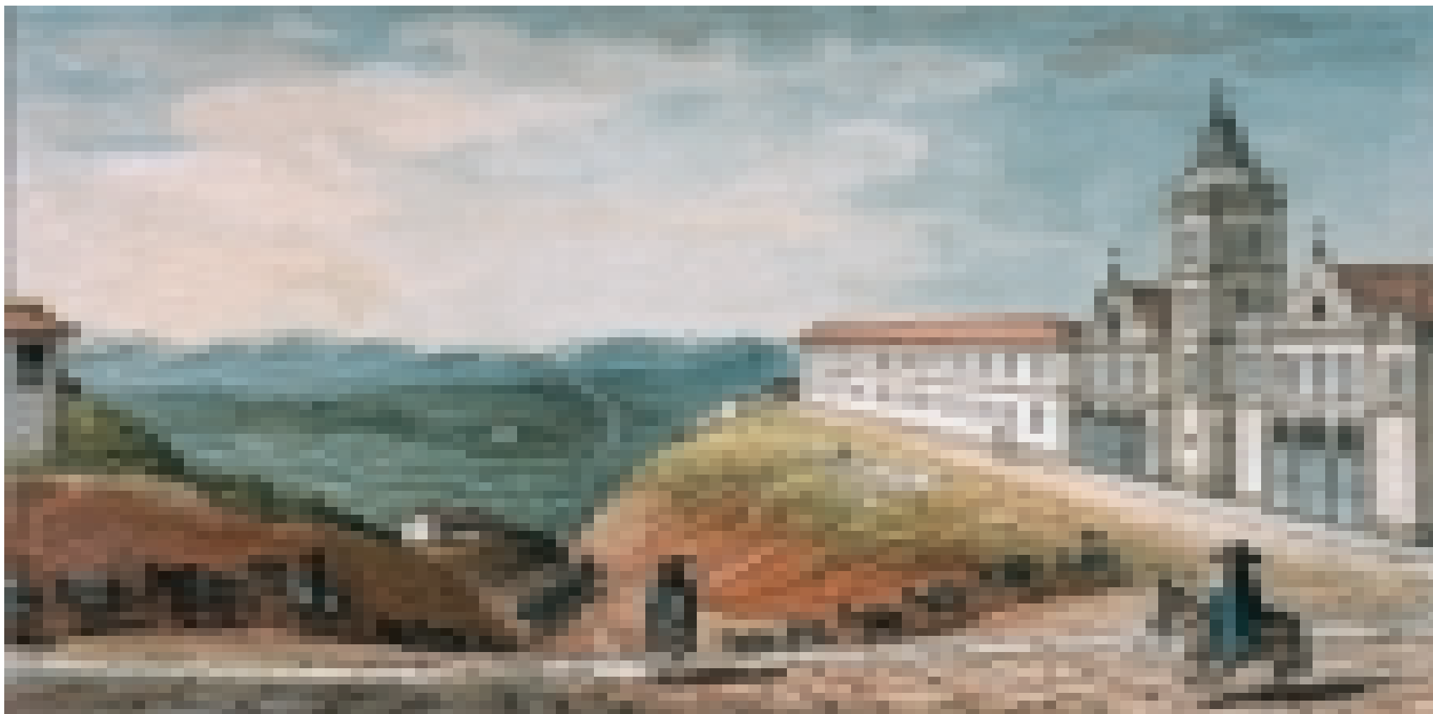
FIGURA 2 – Jean-Baptiste Debret. Entrada de São Paulo pelo caminho do Rio de Janeiro, 1827, aquarela sobre papel, 10,8 x 21,9 cm. Coleção João da Cruz Vicente de Azevedo.