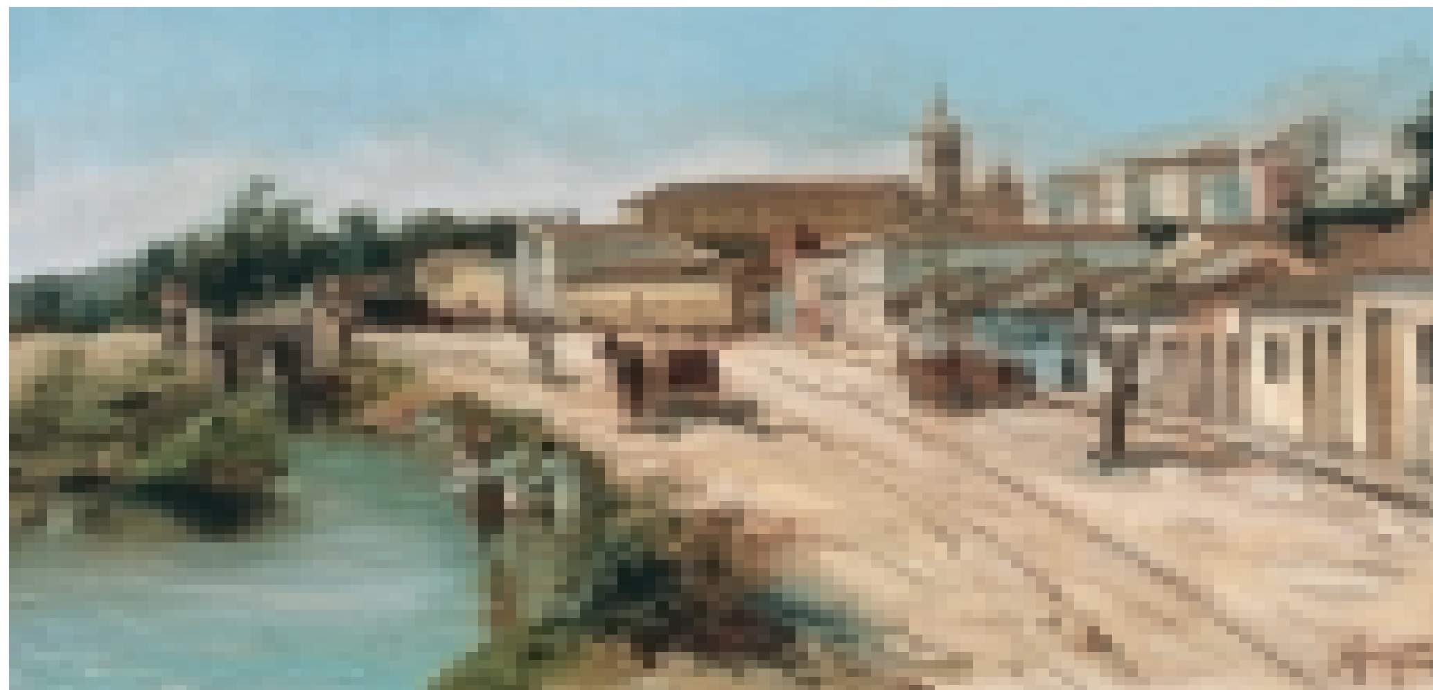
FIGURA 5 – Antonio Ferrigno. Rua 25 de Março, s/d., óleo sobre madeira, 20 x 39 cm. Coleção particular.