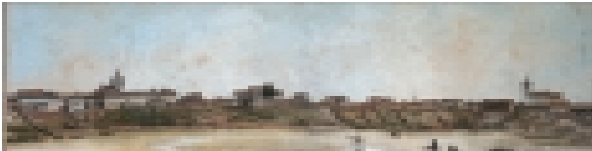
FIGURA 1 – Arnaud Julien Pallière. Panorama da cidade de São Paulo, visto do rio Tamanduateí, 1821, aquarela sobre papel, 15,3 x 57,5 cm. Coleção particular.