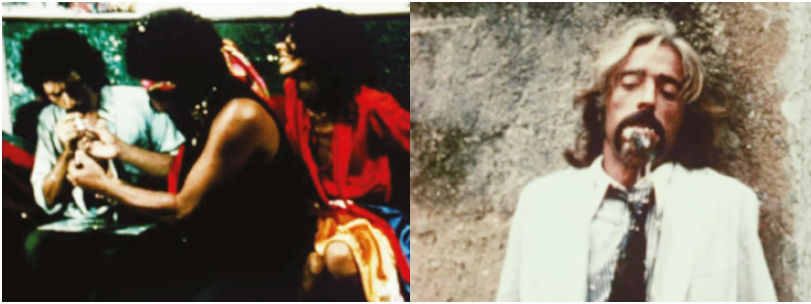
Fig. 8. 9.

Stills do filme Mangue Bangue (1971), Neville d'Almeida, Brasil.