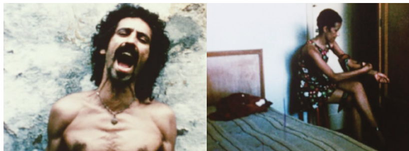
Fig. 4. 5.

de uso de droga injetável, apesar do sentido de agressão presente anteriormente estar apaziguado; o consumo da droga não surge como algo abjeto, como demais representações no filme, mas como mais um dos elementos cotidianos a serem registrados no universo do Manguê. A representação do uso de drogas em Manguê Banguê surge como signo de resistência passiva dos marginalizados diante das convenções burguesas e, mais especificamente, como melhor veremos, como prática ativante de lazer não repressiva, em contraposição ao trabalho alienado.