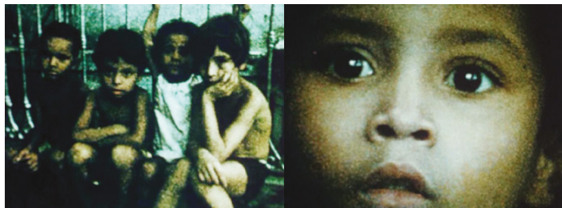
Fig. 6. 7.

Em meio ao filme, apresentam-se novamente as cenas iniciais das travestis, agora em detalhes, como uma continuação. A câmera movimenta-se na mão do operador pelo espaço do Manguê, atentando-se para os corpos das travestis em atividades domésticas aparentemente espontâneas. De um plano frontal de uma das travestis que, tanto pela proximidade da câmera ao corpo quanto pela textura do filme, reforça o aspecto tátil da imagem, passa-se inadvertidamente a uma das crianças que observa a filmagem. Vemos em um plano ainda mais granulado, com pouca luz ambiente, algumas crianças, filhos de prostitutas que trabalhavam no Manguê, até a câmera enquadrar, em primeiríssimo plano, uma dessas crianças a trocar olhares com o operador e a câmera (Figs. 6 e 7). Essa cena, marcadamente documental, integra as personagens ao espaço do Manguê, um ambiente arruinado, precário, como a captação.