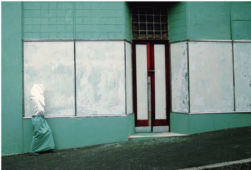
Fig. 11. Capa morada , 2003.

não desaparece na cidade, ela é plasmada a um fundo, reenquadrada como um padrão gráfico e geométrico em uma cidade que, por sua vez, também é transformada em uma geometria abstrata e aplainada pela frontalidade da tomada de vista e pelo privilégio dado, pelo enquadramento, às linhas verticais e horizontais do campo visual. Apenas uma foto da série não obedecia a esse esquema; nesta, a artista aparece descoberta, sentada em um ônibus cheio, ao lado de outros sul-africanos; curiosamente esta é a única em que a artista de fato se “desmargina” no meio cidade.