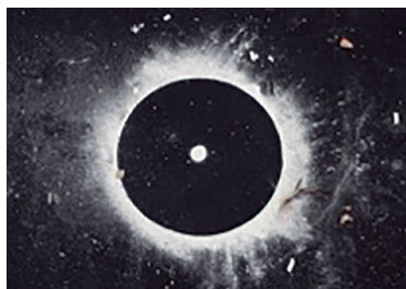
Fig. 8 e 9. The family in disorder – detalhe da galeria maior.