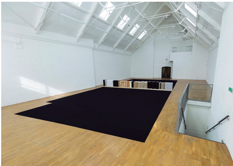
Fig. 2 e 3. The family in disorder – galeria menor e galeria maior antes da intervenção dos seis montadores e artistas.