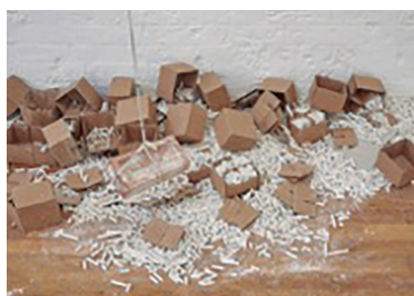
Fig. 6 e 7. The family in disorder – detalhes da galeria maior.

Se aquelas formas autônomas citavam diretamente o slide show não é possível saber, assim como não é possível adivinhar a quem deve ser atribuída sua autoria. O trabalho retira sua força dessa indistinção, pois não estamos em uma sala cheia de objetos independentes, de autorias distintas, dispostos lado a lado segundo algum tipo de padrão ou ordenação. Ao contrário, a sala nos provoca duas experiências distintas, que se alternam mas não se anulam: de um lado, a apreensão de uma totalidade, um overall abstrato que parece querer se expandir para além das paredes. De outro, uma atenção aos detalhes e pequenos acontecimentos visuais. Em outras palavras: enquadrar e desenquadrar.