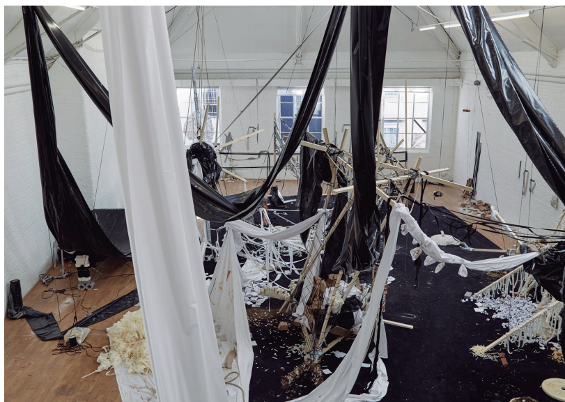
Fig. 4 e 5. The family in disorder , vistas da galeria maior depois da intervenção dos seis montadores e artistas.