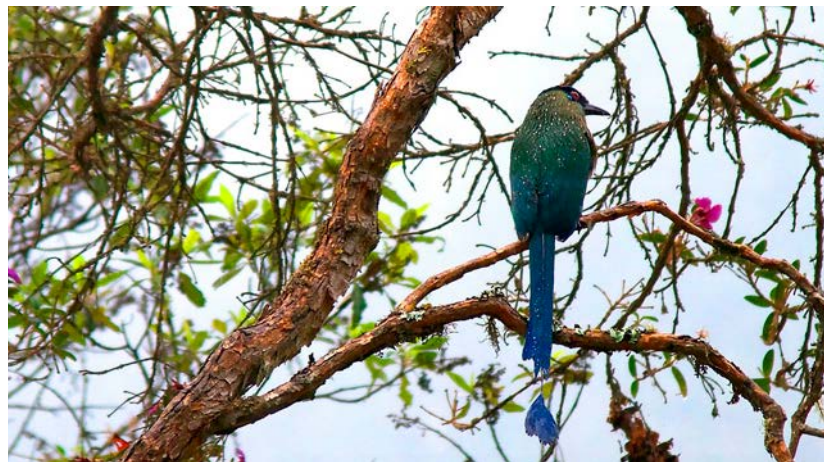
Fig. 2. Barranquero después de la lluvia, Valle del Cocora, Risaralda, Colombia.

Un componente fundamental del legado del trabajo de Florence radica en una invitación a salir, a involucrarse con el trabajo de campo, a escuchar la voz de la naturaleza en su espacio propio. Como parte de la metodología de investigación del proyecto se planeó una serie de salidas de campo para interactuar directamente en el espacio vivo de las aves y otros animales, en un principio se pensó en una visita al Amazonas, pero posteriormente se decidió que un lugar más cercano sería más apropiado para consolidar la metodología.