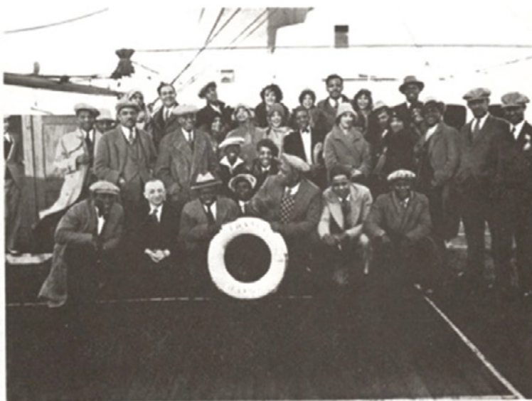
Les Lew Leslie's Black Birds à leur arrivée en France, à bord du paquebot "France".

A guarnição da penitenciária de Kanala, Nova Caledônia. (Álbuns E. Robin).