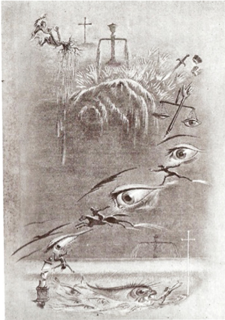
“ Derniers dessins de J.-J. Grandville : Premier Rêve. — Crime et Expiation ” Magasin Pittoresque, 1847, p. 212.

Eis o desenho com o olho arregalado e devorador da justiça, que se torna um peixe devorador: