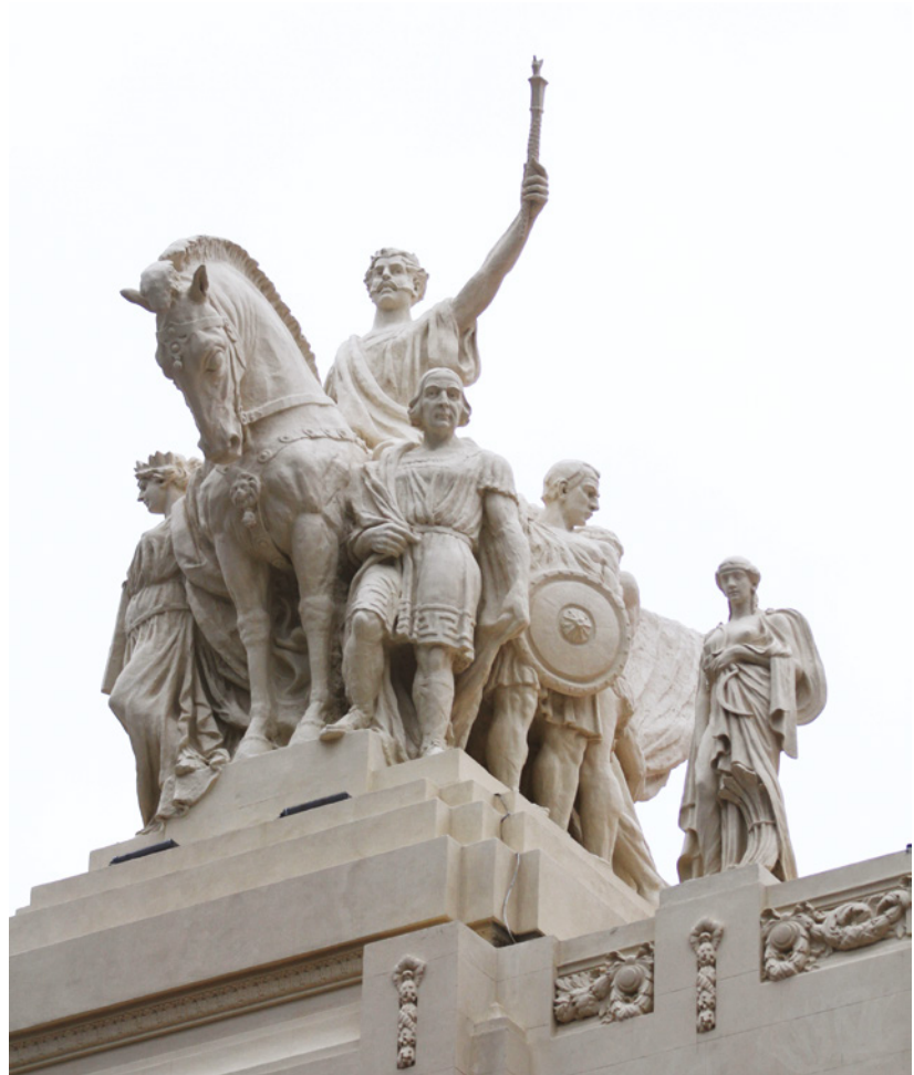
Fig. 6. Alegoria da Independência, 2017.

No topo da fachada há duas representações, da Independência e da República. A primeira caracteriza-se pela figura equestre de Dom Pedro I, trajado à romana, empunhando o cetro imperial e coroado de louros, presentes nos triunfos da Antiguidade 26 . O imperador apresenta-se acompanhado pela figura de José Bonifácio, conhecido como Patriarca da Independência e ladeado por estátuas que representam a Liberdade, a Força Cívica e Militar. A segunda representação apresenta Deodoro da Fonseca, também montado a cavalo e com a espada empunhada, trajado à maneira clássica. Este é ladeado pela República e por Benjamin Constant, conhecido como Apóstolo da República, com um livro ao peito. Por fim, entre as estátuas encontram-se as principais bases econômicas nacionais: a Agricultura, o Comércio, a Viação e a Indústria, ladeando a Liberdade e a Autoridade e apoiadas na Lei.