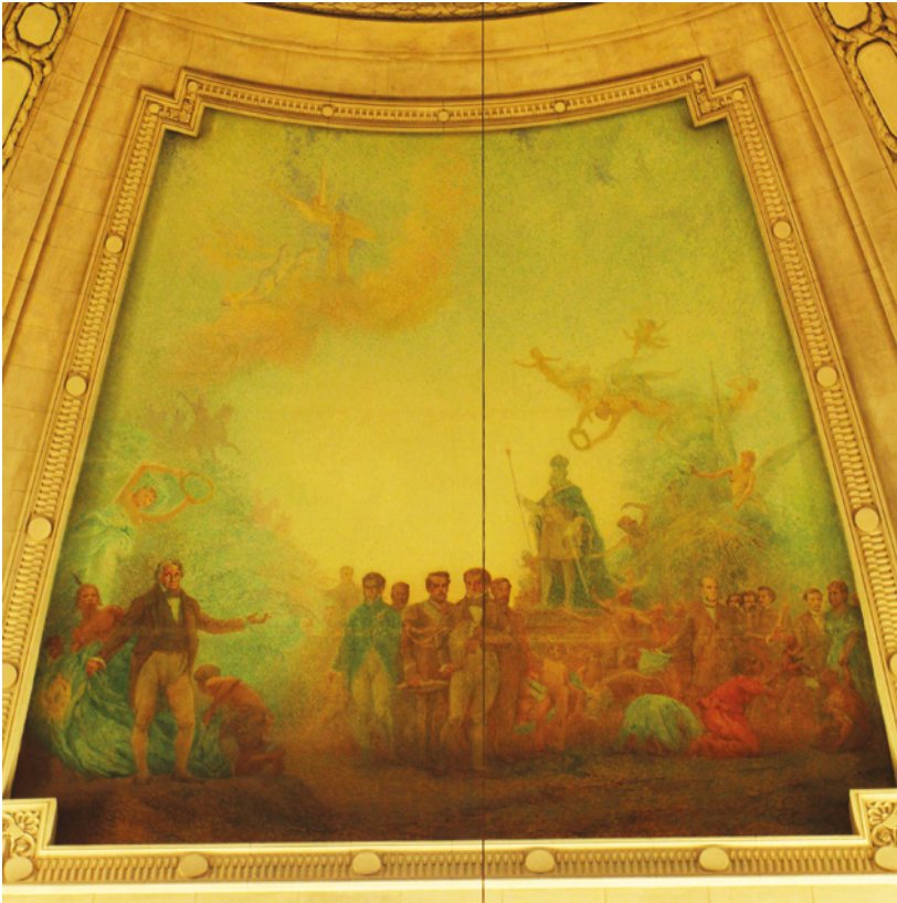
Fig. 9. A Monarquia, 2017.

33. Figuras infantis, às vezes representadas nuas, às vezes com asas, em cenas mitológicas no Renascimento.