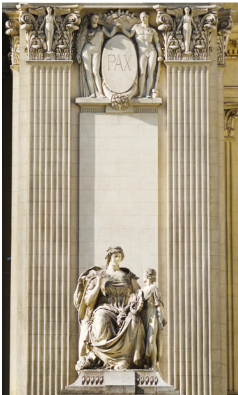
Fig. 5. Alegoria do Progresso, 2017.