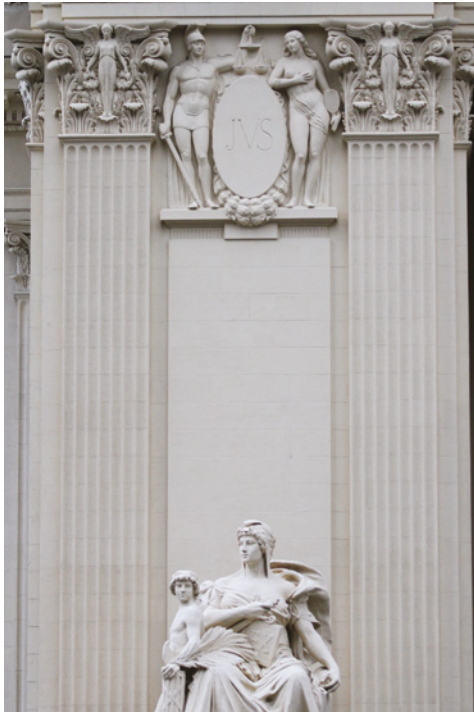
Fig. 4 Alegoria da Ordem, 2017.

Arte, poder e tradição: o Palácio Tiradentes e a construção de um imaginário político e republicano brasileiro