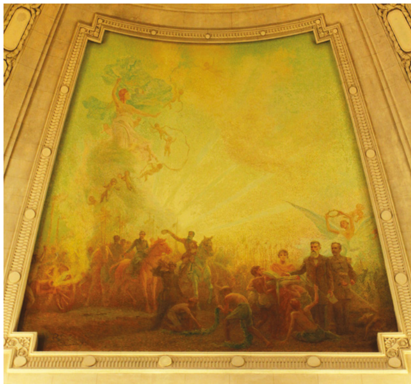
Fig. 10. A República, 2017.

Novamente, apresenta-se como notória a promoção do culto aos grandes vultos da tradição política brasileira, com ênfase nas referências preconizadas pela vertente republicana positivista. Permeando a linha histórica representada nas imagens dispostas nos painéis, os elementos simbólicos greco-romanos associam-se aos principais ícones artísticos do poder, acentuando a representação didática proporcionada pela visualidade narrativa. No contexto geral da decoração, a relação entre tradição e modernidade faz-se premente na construção artística da narrativa histórica da identidade política brasileira.