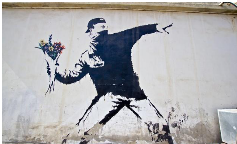
Figura 3: Banksy, Soldier throwing flowers , 2005, Palestina.

Um dos trabalhos que já produziu não apenas muitas intervenções nessa esfera como também se tornou emblemático nessa modalidade de arte-ativismo foi produzido pelo artista britânico Banksy, em suas projeções em muros e paredes da faixa de Gaza nos primeiros anos do século XXI. Recorrendo ao estêncil como forma de reprodução, o artista aplica seus moldes de acetatos, que são preenchidos a tinta, nas superfícies de paredes e escombros – um trabalho, portanto, cuja produção nasce declaradamente sob o signo do design . Recursos que, evidentemente, não seriam capazes de imprimir nenhuma singularidade ao trabalho estético, não fosse o diálogo que o figurativismo estabelece com o entorno em que a obra foi instalada, como se pode verificar na reprodução abaixo [Fig. 3].