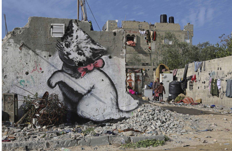
Figuras 4 e 5: Banksy, Sem título, 2014, Faixa de Gaza. FONTES: < http://ansabrasil.com.br/brasil/noticias/brasil/cultura/2015/02/26/Muros-Gaza-ganham-grafites-Banksy_8372156.html > e < https://www.scoopnest.com/pt/user/Estadão/571370740152315904-banksy-grafita-escombros-na-faixa-de-gaza-veja-fotos > . Acesso em: 10 de janeiro de 2019.

Os grafites de Banksy desenhados nos escombros de assentamentos repetem a intervenção como ato transgressor. As duas reproduções reportam-se a experiências estéticas distintas. Enquanto o grafite inspirado em Rodin é mais afirmativo, no sentido de chamar à consciência, o grafite do gatinho é mais sutil. Ambos, contudo, oscilam entre a paródia e a ironia, produzindo o mesmo efeito de desestabilização e de choque.