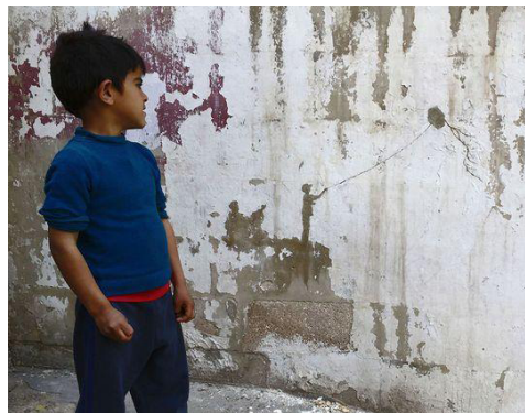
Figuras 6 e 7: Pejac (Silvestre Santiago), Arte de rua: Pinturas invertidas , Assentamento palestino Al-Hussein, em Amman, Jordânia, 2016. FONTE: < http://art-tension.tumblr.com/post/143985964665 >. Acesso em: 20 de maio de 2018

Para a reportagem jornalística, as vias internas do assentamento de Al-Hussein, em Amman, na Jordânia, são construções de muros e paredes desgastadas e corroídas, que revelam a precariedade das condições de vida das pessoas que nele habitam. Para o artista catalão Silvestre Santiago, que assina apenas como Pejac, as formas geradas pela corrosão se tornaram superfícies para intervenções e a produção de códigos gráficos capazes de dizer coisas que as paredes