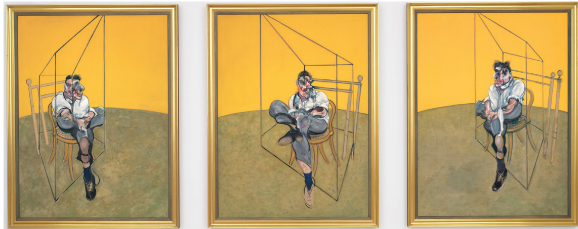
Figura 1. Francis Bacon: Três estudos de Lucian Freud , (1969b). Óleo sobre tela, 198 x 147,5 cm.

Quanto à análise genética , Machado refere-se à primazia no ato de pintar de Bacon, de acordo sempre com Deleuze, uma “manipulação do acaso”, discutindo a relação das manchas livres com o controle (a própria autocrítica do pintor); relação inclusive que se associa à discussão do diagrama ao mesmo tempo como caos e ordem em suas pinturas. Retomaremos detalhadamente essa abordagem