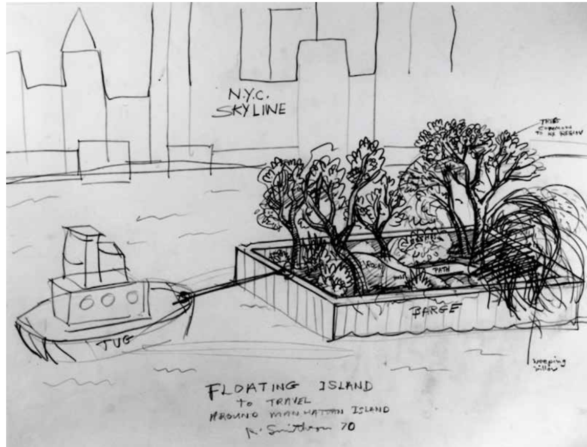
Figura 1. Robert Smithson, Floating Island to Travel Around Manhattan , 1970. Desenho.

Um dos exemplos que menciona é Floating island , de Robert Smithson. Originalmente, a obra é um desenho rápido feito à mão em 1970, um simples esboço de Smithson que representa um rebocador sobre a água puxando uma balsa coberta de terra, arbustos e árvores diante de um horizonte de prédios ao fundo, acompanhado de breves inscrições indicativas como “rebocador” ( tug ), “balsa” ( barge ), “perfil