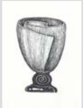
Copos para abstêmios, 4,5 x 3 cm