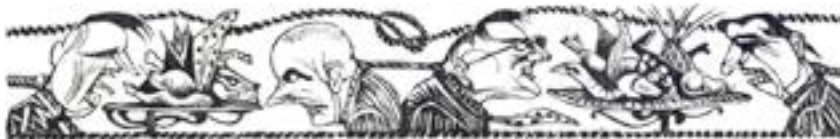
Série Arte Menor - Frisos Figurativos, s.d., xilogravura.

Do vazio à expressão (ou: sem concessões): entrevista com Rubem Grilo