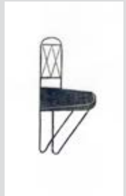
Cadeiras para equilibristas, 5 x 2,5 cm