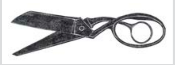
Tesouras para arremate, 3 x 8 cm