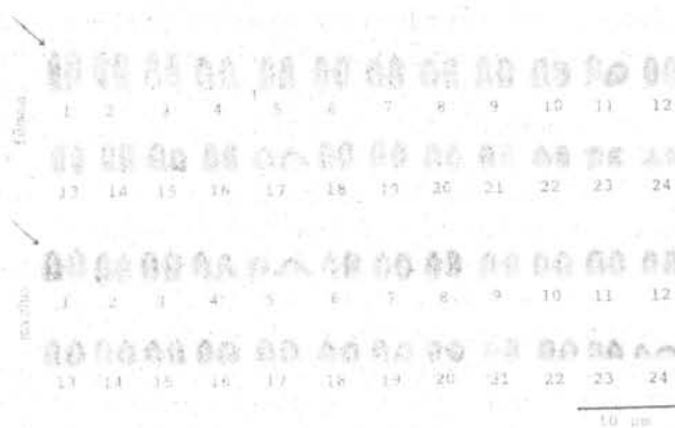
Fig. 1. Cariótipos de fêmeas e macho de Micropogonias furnieri . Os cromossomos foram montados em ordem decrescente de tamanho. As flechas indicam a constricção secundária na região proximal ao centrômero, do primeiro par.

Na Figura 2a, está o cariótipo M. furnieri , mostrando bandas C, podendo-se perceber a presença de heterocromatina nas regiões centroméricas dos cromossomos, variando em intensidade em cada par. Alguns pares apresentam heterocromatina intercalares e telomérica, evidenciadas nas melhores metáfases. Na Figura 2b,