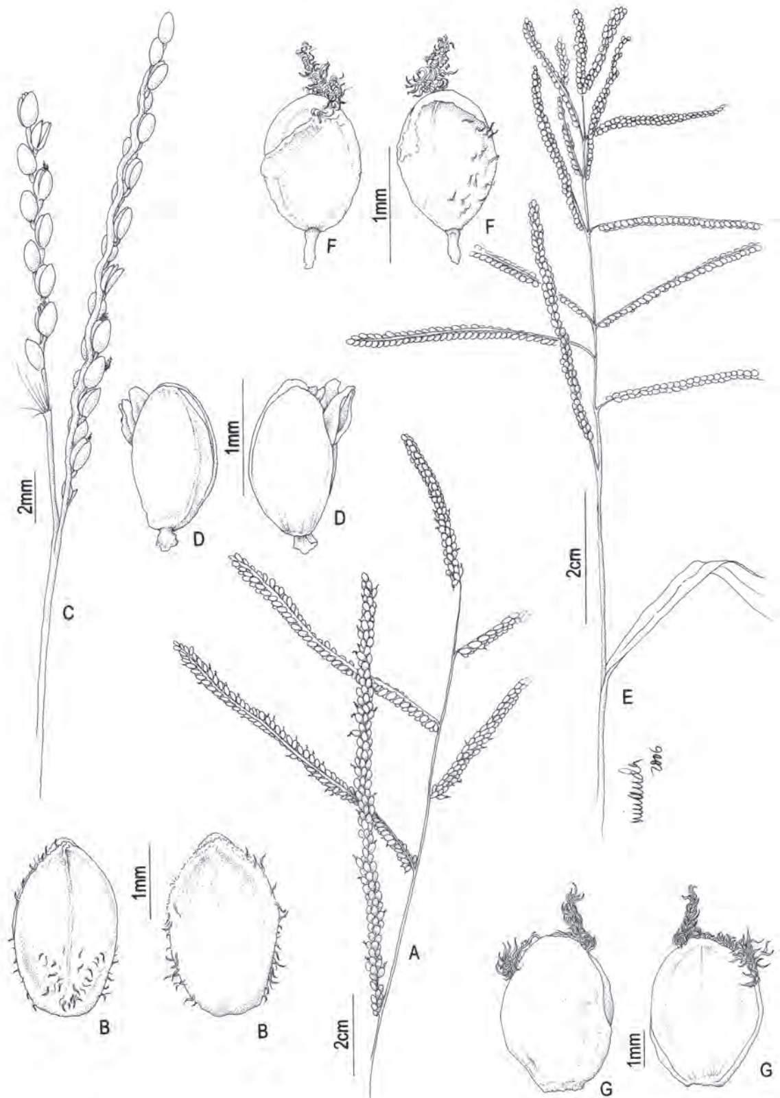
Fig. 10: A-B Paspalum dilatatum : A. inflorescência; B. espiguetta vista da gluma superior; B'. espiguetta vista do lema inferior. C-D P. hyalinum : C. inflorescência; D. espiguetta vista do lema inferior; D'. vista da gluma superior. E-F P. juerguensis : E. inflorescência; F. espiguetta vista do lema inferior; F'. espiguetta vista da gluma superior. G P. notatum : espiguetta vista da gluma superior; G'. espiguetta vista do lema inferior. (A-B Dias-Melo 241; C-D Ferreira 1022; E-F Dias-Melo 169; G Ferreira 953).