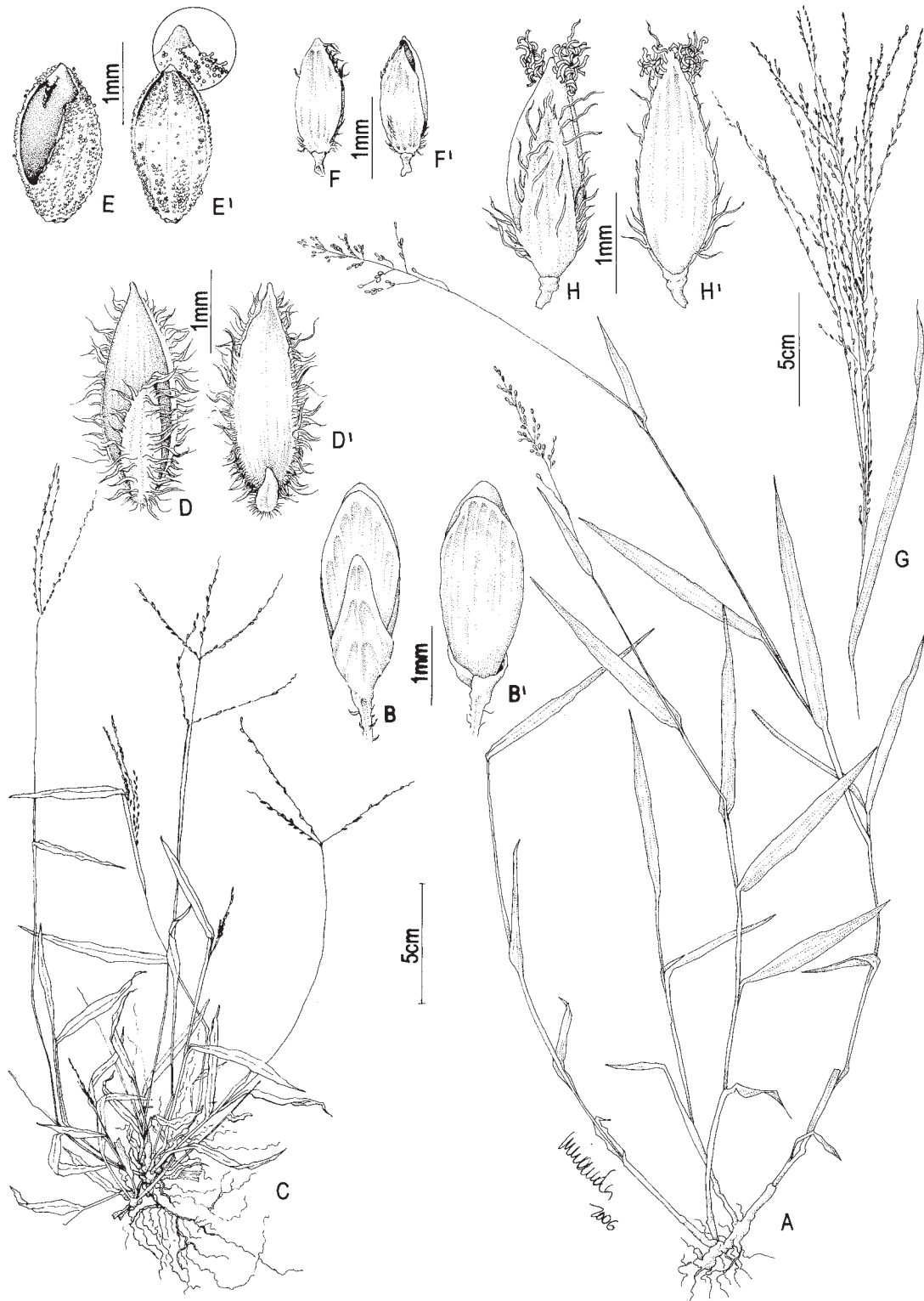
Fig. 6: A-B Dichantherium superatum : A. hábito; B. espiguetta vista da gluma inferior; B'. espiguetta vista da gluma superior. C-D Digitaria ciliaris : C. hábito; D. espiguetta vista da gluma superior; D'. espiguetta vista gluma inferior. E D. corynotricha : espiguetta com parte do lema inferior removido para evidenciar o antécio superior; E' espiguetta vista do lema inferior evidenciando os tricomas claviformes (detalhe). F D. fuscescens : espiguetta vista da gluma inferior; F'. espiguetta vista da gluma superior. G-H D. horizontalis : G. inflorescência; H. espiguetta vista da gluma inferior; H'. espiguetta vista da gluma superior. (A-B Ferreira 992, C-D Ferreira 954, E Ferreira 951, F Ferreira 565, G-H Dias-Melo 235b).