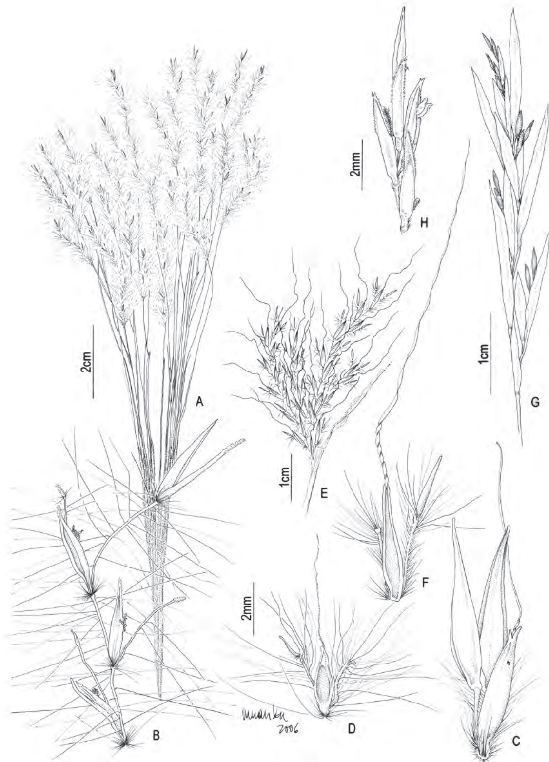
Fig. 1. A-B Andropogon bicornis : A. inflorescência, B. pares de espiguetas; C. A. lateralis : par de espiguetas; D. A. leucostachyus : par de espiguetas; E-F A. macrothrix : E. inflorescência, F. par de espiguetas; G-H A. virgatus : G. inflorescência, H. pares de espiguetas. (A-B Dias-Melo 163; C Dias-Melo 16; D Dias-Melo 167; E-F Oliveira 15; G-H Ferreira 686).