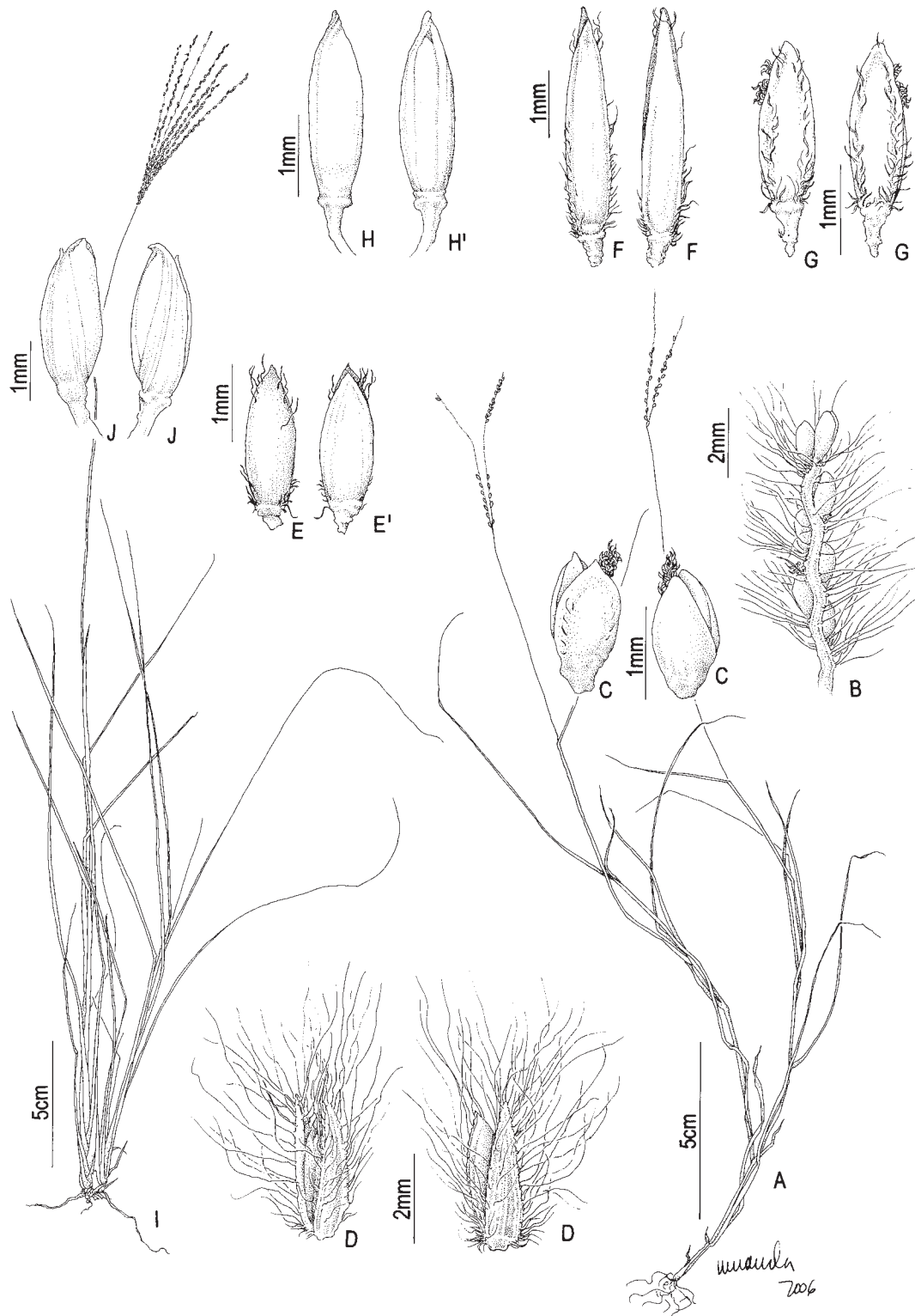
Fig. 5: A-C Axonopus aureus : A. hábito; B. ráquis; C. espiguetta vista da gluma superior; C'. espiguetta vista do lema inferior. D. A. brasiliensis : espiguetta vista do lema inferior; D' espiguetta vista da gluma superior. E. A. complanatus : espiguetta. F. A. fastigiatus : espiguetta vista gluma superior; F' espiguetta vista lema inferior. G. A. fissifolius : espiguetta vista da gluma superior; G' espiguetta vista lema inferior. H. A. polystachyus : espiguetta vista da gluma superior; H' espiguetta vista do lema inferior. I-J A. siccus : I. hábito; J. espiguetta vista da gluma superior; J' espiguetta vista do lema inferior. (A-C Dias-Melo 244; D Ferreira 604, Dias-Melo 223; E Dias-Melo 172; F Dias-Melo 177; G Oliveira s.n. (CESJ 25529); H Oliveira 31; I-J Ferreira 607).