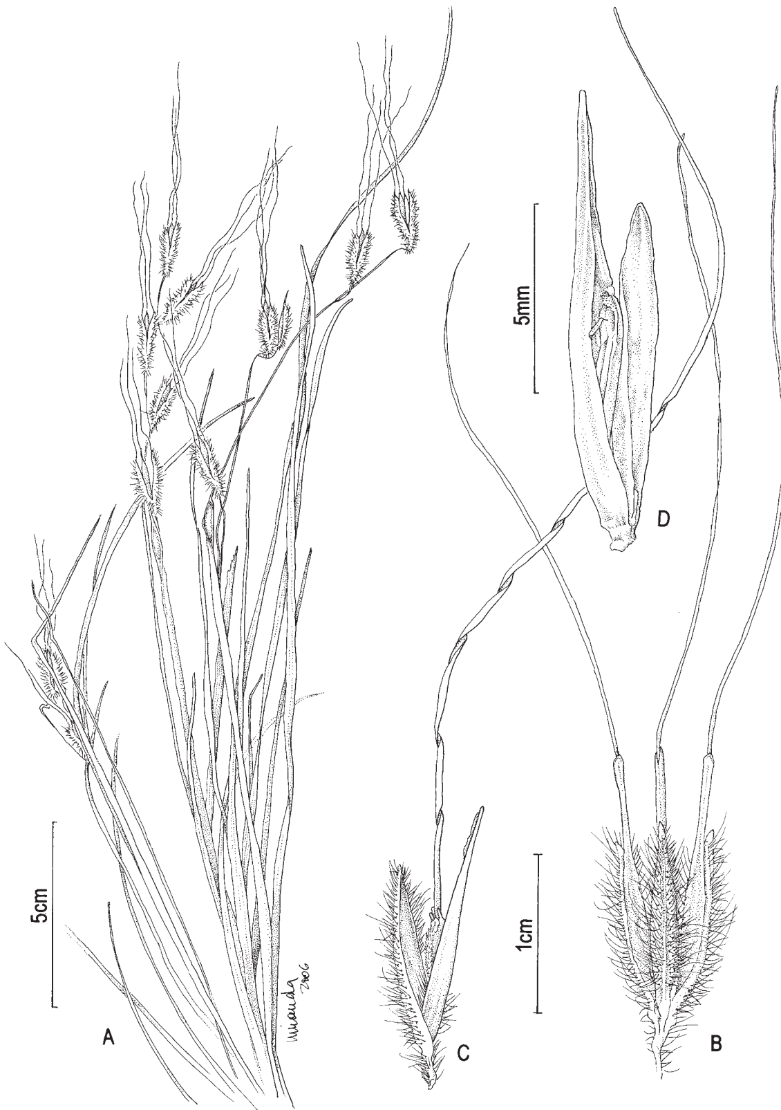
Fig. 4: A-D Loudetiopsis chrysothrix A. hábito; B. tríade de espiguetas; C. espiguetas isolada; D. antécio inferior com flor masculina. (A-B Medeiros 356; C-D Dias-Melo 140).