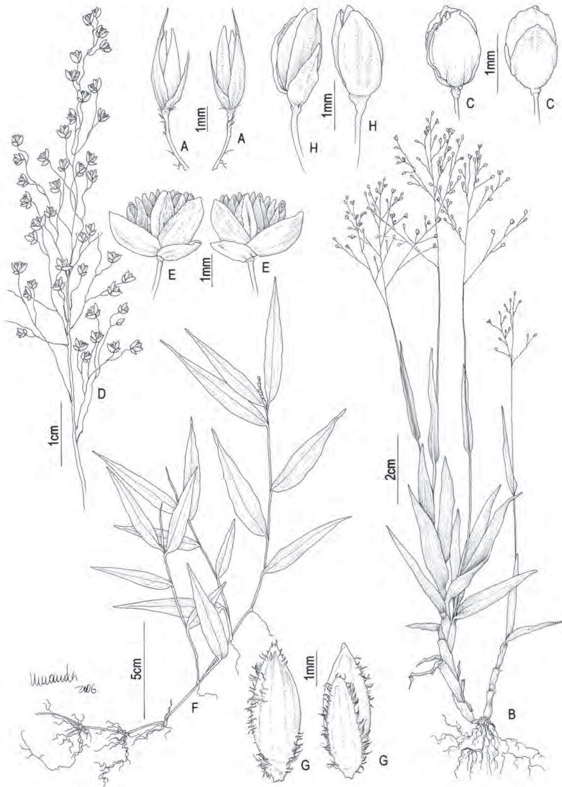
Fig. 9: A. Panicum aristellum : espiguetas. B-C P. cyanescens : B. hábito; C. espiguetas vista da gluma superior; C'. espiguetas vista da gluma inferior. D-E P. euprepes : D. inflorescência; E. espiguetas vista lateral. F-G P. ovuliferum : F. hábito; G. espiguetas vista da gluma superior; G'. espiguetas vista da gluma inferior. H P. sellowii : espiguetas vista da gluma inferior; H'. espiguetas vista da gluma superior. (A Dias-Melo 18; B-C Dias-Melo 153; D-E Forzza 3549; F-G Ferreira 947; H Dias-Melo 139).