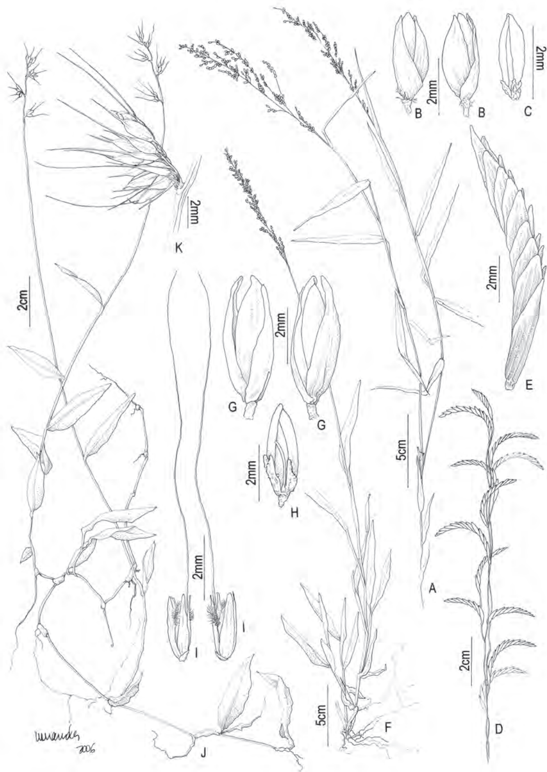
Fig. 8: A-E Ichnanthus inconstans : A. hábito; B. espiguetta vista da gluma inferior; B'. espiguetta vista da gluma superior; C. lema superior com apêndices aliformes na base; D. ramos da inflorescência teratológica; E. detalhe do ramo florífero teratológico. F-H I. leiocarpus : F. hábito; G-G'. espiguetta vista lateral; H. lema superior com apêndices aliformes na base. I-I' Melinis minutiflora : espiguetta vista lateral. J-K Oplismenus hirtellus : J. hábito; K. racemo com grupo de espiguetas. (A-E Ferreira 574; F-H Forzza 3296; I Dias-Melo 186; J-K Forzza 3315).