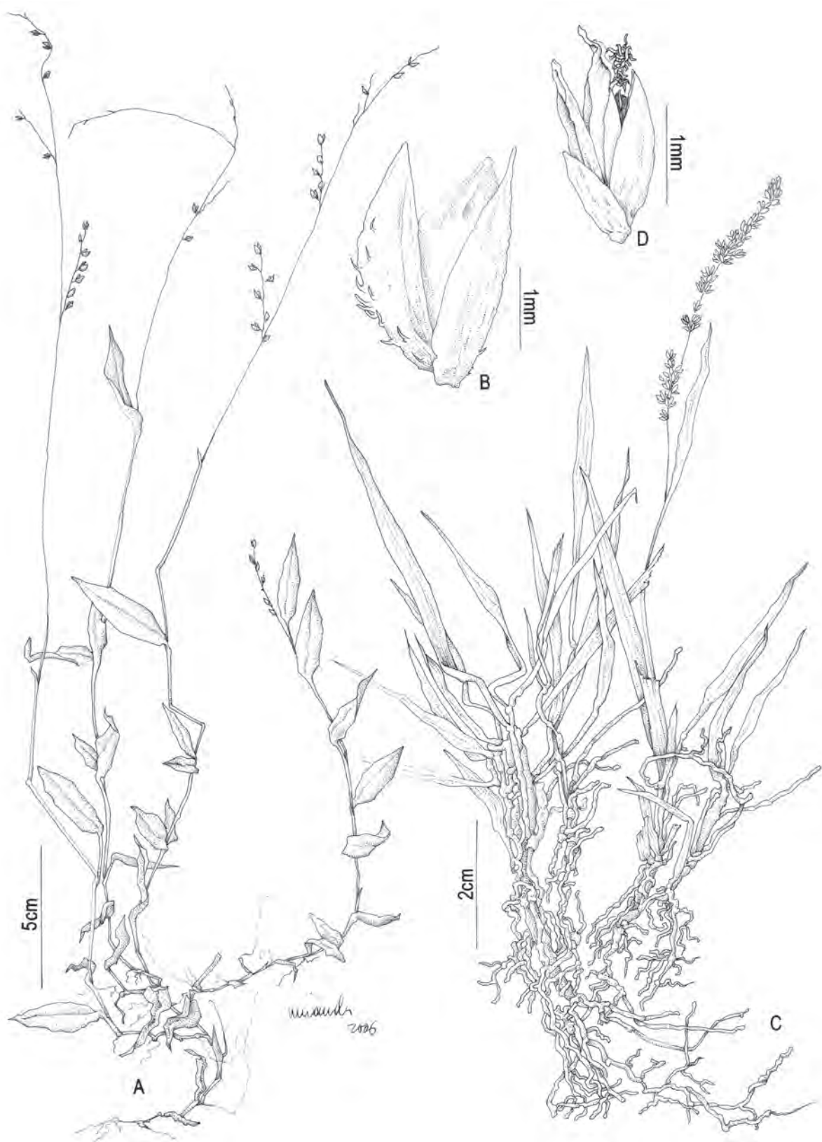
Fig. 12: A-B Pseudochinolaena polystachya : A. hábito; B. espigueta. C-D Steinchisma decipiens : C. hábito; D. espigueta. (A-B Dias-Melo 226; C-D Oliveira 61).