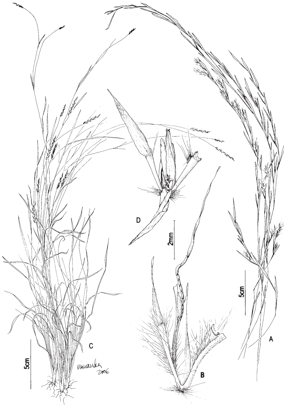
Fig. 3: A-B Schizachyrium condensatum : A. hábito; B. par de espiguetas. C-D S. tenerum : C. hábito; D. par de espiguetas (A-B Dias-Melo 231; C-D Dias-Melo 164).