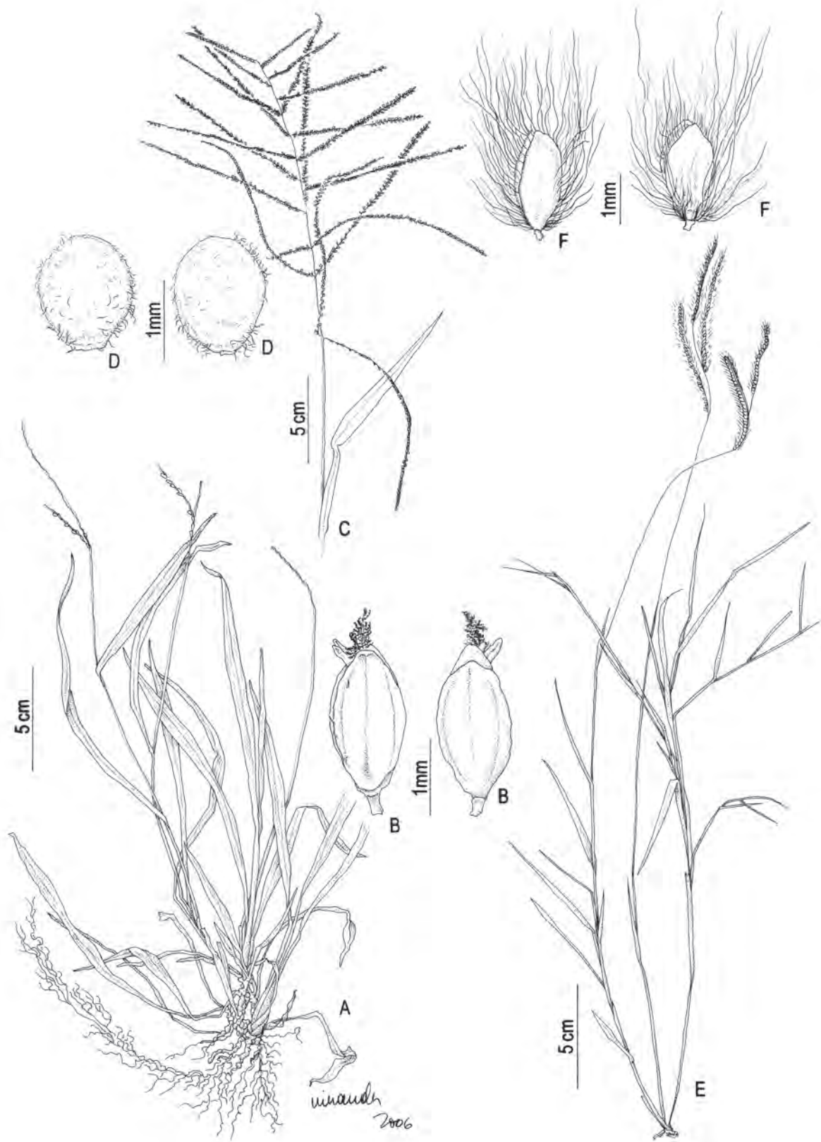
Fig. 11: A-B Paspalum nutans : A. hábito; B. espiguetta vista da gluma inferior; B'. espiguetta vista da gluma superior. C-D P. paniculatum : C. inflorescência; D. espiguetta vista da gluma superior; D'. espiguetta vista do lema inferior. E-F P. polyphyllum : E. hábito; F. espiguetta vista do lema inferior; F'. espiguetta vista da gluma superior. (A-B Dias-Melo 11, Dias-Melo 183; C-D Ferreira 949; E-F Forzza 3131).