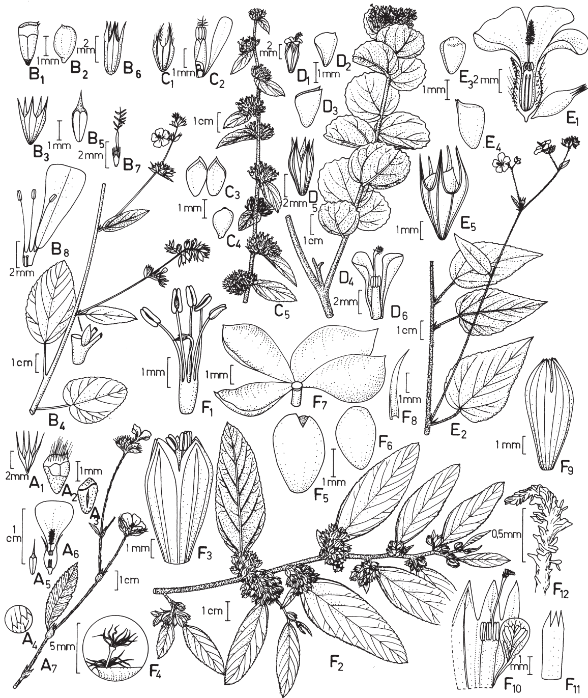
Fig 2. STERCULIACEAE. Waltheria . A1-A8 – W. macropoda : A1. Fruiting calyx with capsule, A2. Capsule with apical operculate cap. Distal portion of chartaceous membrane and verrucate seed (base). A3. Verrucate seed, lateral view, A4. Apiculate teeth of adaxial leaf margin, A5. Calyx, segment removed, A6. Pin flower, bisected, A7. Habit, A8. Detail of stipule. B1-B8 – W. albicans : B1. Capsule, with green apical and basal foliaceous portion, medial transparent membranous portion, B2. Seed, Lateral view, B3. Fruiting calyx, B4. Habit with detail of stipule, B5. Calyx segment, removed, B6. Calyx, B7. Gynoecium, B8. Corolla and androecium (2 stamens, 4 petals removed). C1-C5 – W. indica : C1. Calyx, 3 segments removed, C2. Corolla (4 petals removed), androecium, gynoecium, C3. Bivalvate capsule, adaxial view, C4. Seed, lateral view, C5. Habit. D1-D6 – W. aspera : D1. Pin flower, D2. Seed, lateral view, D3. Capsule, dehiscent along apex, D4. Habit, D5. Calyx, D6. Pin corolla (3 petals removed), androecium and gynoecium. E1-E5 – W. viscosissima : E1. Pin flower (2 petals removed) and bud, E2. Habit, E3. Seed, lateral view, E4. Capsule, dehiscent at apex on dotted line, E5. Fruiting calyx with capsule. F1-F12 – W. ferruginea : F1. Thrum androecium and gynoecium, F2. Habit, F3. Thrum flower, F4. Stem with stipitate, stellate trichome, F5. Capsule, opened, obplacental view, dehiscent at apex, F6. Seed, lateral view, F7. Bracts, adaxial view, F8. Bracteole, adaxial view, F9. Pin flower, abaxial view, F10. Pin flower, adaxial view, opened, with 2 calyx lobes, 4 petals removed, F11. Pin staminal tube, anthers removed, F12. Pin stigma.