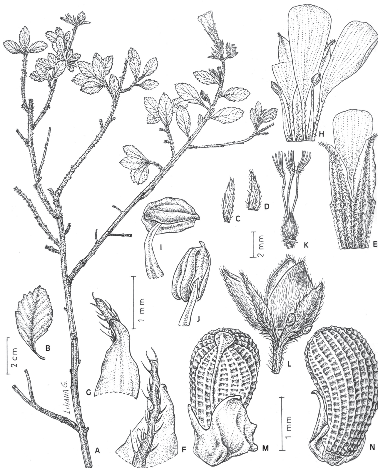
Fig. 2. TURNERACEAE. A-N. Turnera coccinea . A, rama con flores axilares solitarias. B, hoja. C-D, perfiles. E, porción del cáliz, cara externa, y un pétalo. F-G, ápice de un lóbulo del cáliz, cara externa e interna. H, flor heterostila, porción del cáliz, cara interna, con 3 pétalos y 2 estambres adnatos; de la cuadrícula la cicatriz dejada al desprender un estambre. I-J, antera, vista lateral y dorsal. K, gineceo. L, fruto epifilo y perfil, hoja tectriz con nectarios. M-N, semilla y arilo, vista rafeal y cara opuesta.