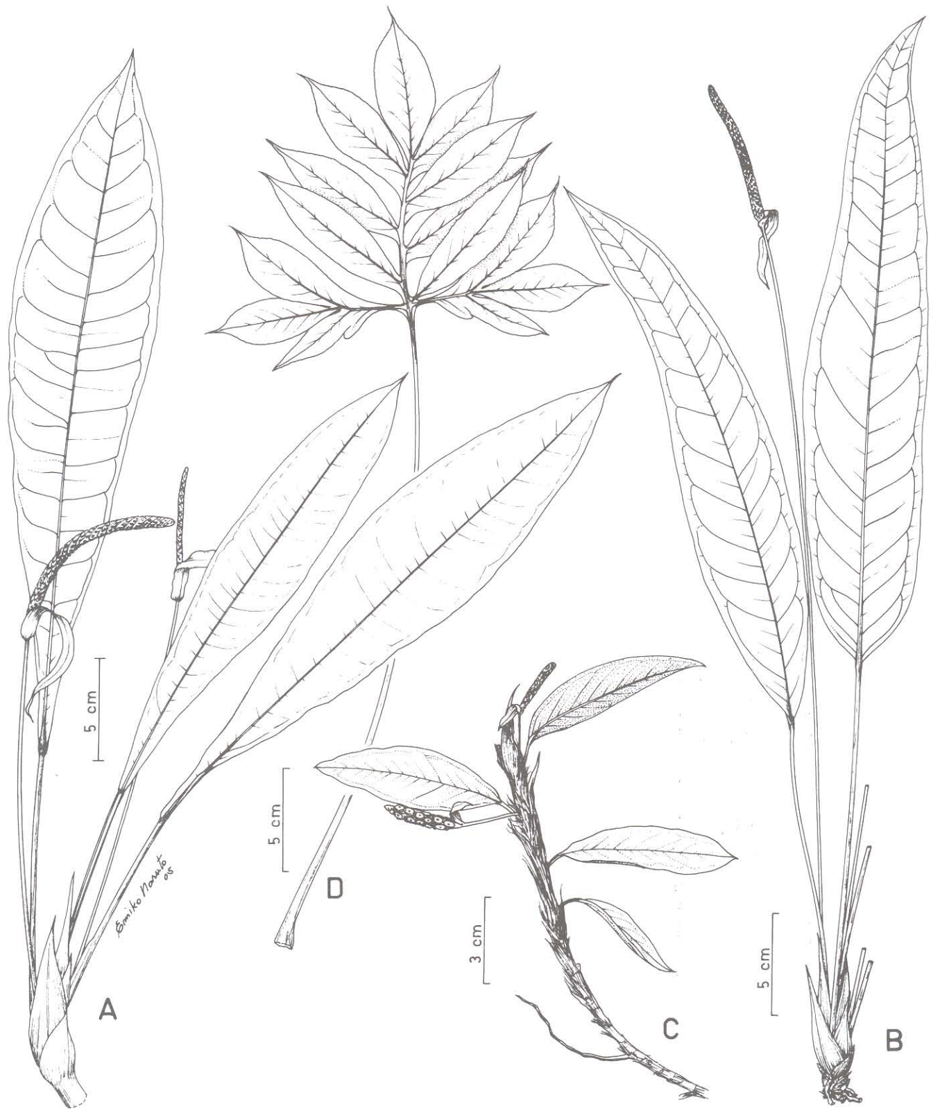
Fig. 1. A. Anthurium aff. intermedium , hábito; B. A. megapetiolatum , hábito; C. A. scandens , hábito. D. Asterostigma cf. cryptostylum , folha.