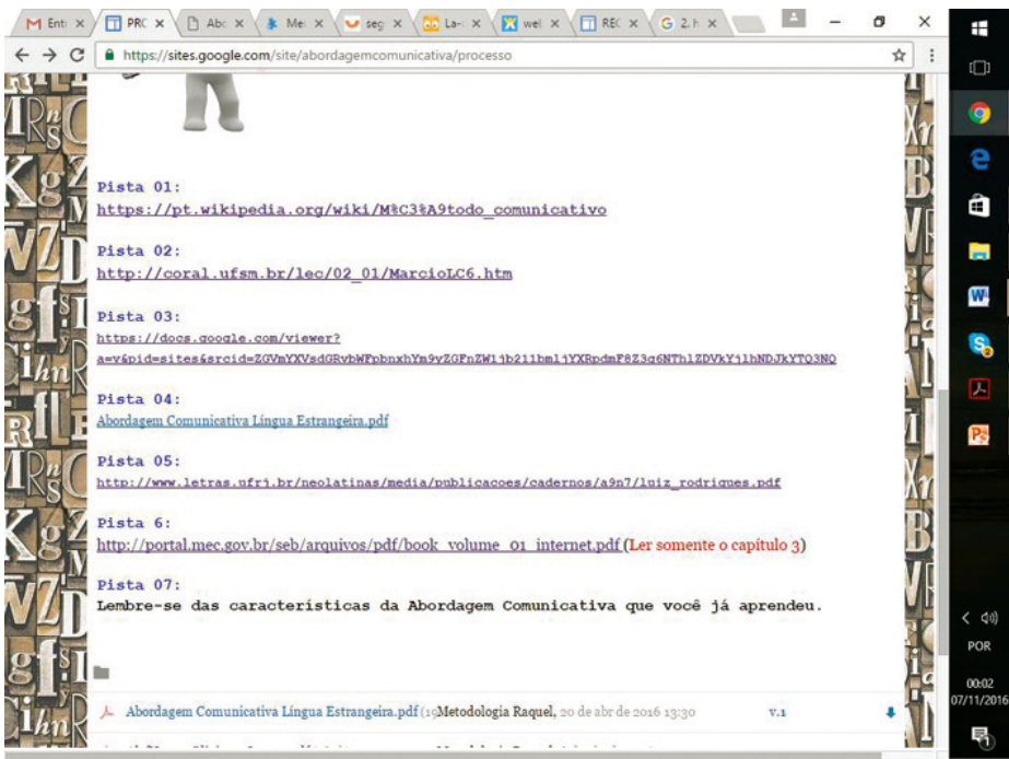
Figura 3: PrintScreen de tela da Internet – Abordagem Comunicativa: Processo.

inferior, que o grupo aprendeu também a disponibilizar para o leitor textos para download.