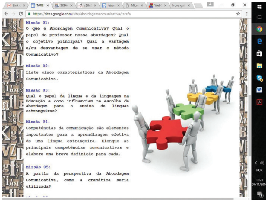
Figura 2: PrintScreen de tela da Internet – Abordagem Comunicativa: Tarefa

Na Figura 3, observamos que o grupo aprendeu a inserir âncoras que nos remetem não somente aos textos internos da própria WQ , mas também a várias páginas da internet que dizem respeito à Metodologia Comunicativa. Podemos notar que os links remetem a textos de variadas fontes e incluem desde textos da Wikipedia e artigos científicos até um texto preparado pelo próprio grupo 3 . Além disso, podemos observar na Figura 3, na parte