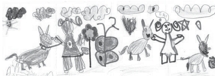
Tira elaborada por Suriá (5 anos)

A dona deu comidinha para o cachorro. Depois ele ia passear. É uma coleira (mostrando o desenho). Não é uma coleira. Ele pensou depois que a dona dele ia dar muito mais biscoito. Vou fazer a dona dele (desenha). A dona pensou que já deu muito biscoito.