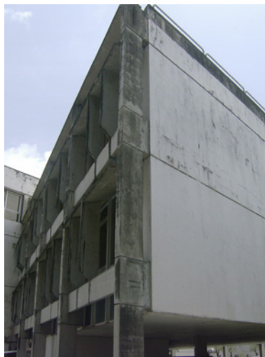
FIGURA 7 (dir.)

Edifício da CELPE. Manchas generalizadas.