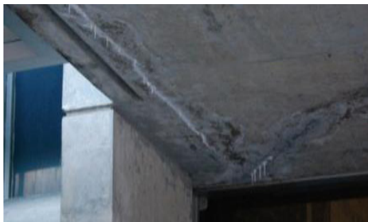
FIGURA 4 (esq.)

Edifício da CELPE. Danos da marquise - eflorescências.