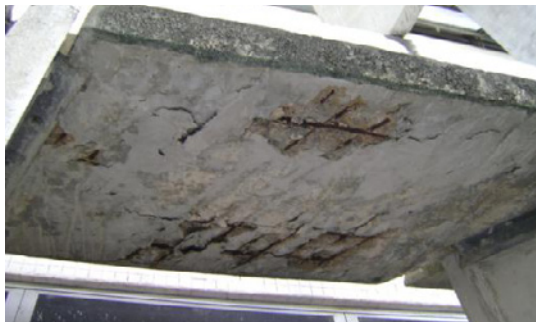
FIGURA 5 (dir.)

Edifício da CELPE. Corrosão com destacamento de concreto – brise .