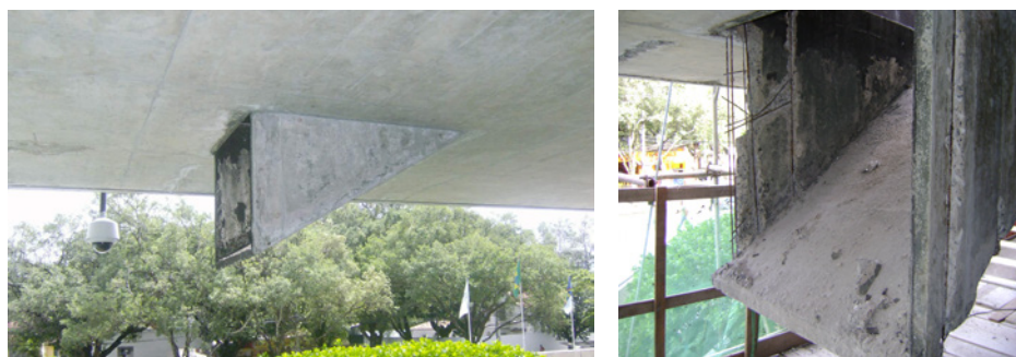
FIGURA 19 (dir.)

Fachada principal do edifício da CELPE, em 2008, antes da intervenção. Rusticidade original, sem revestimento.