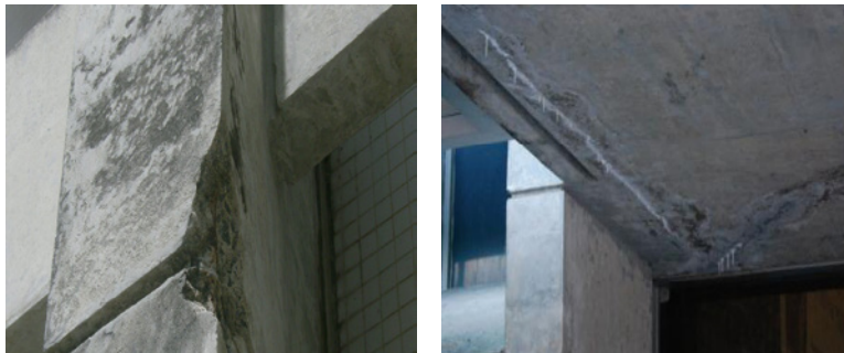
FIGURA 11 (dir.)

Pilar de fachada do edifício. Corrosão de armadura e destacamento de concreto.