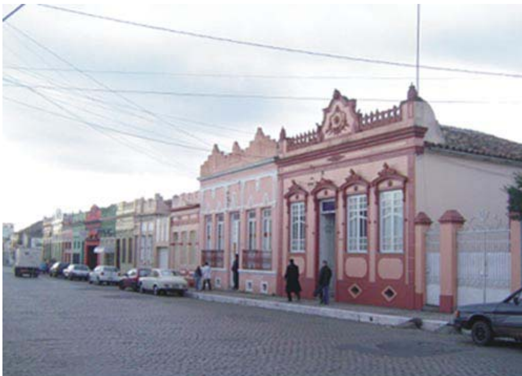
FIGURA 7 - Conjunto arquitetônico remanescente em estilo eclético situado à rua D. Pedro II, um dos quarteirões íntegros na cidade, com poucas descaracterizações em suas edificações.