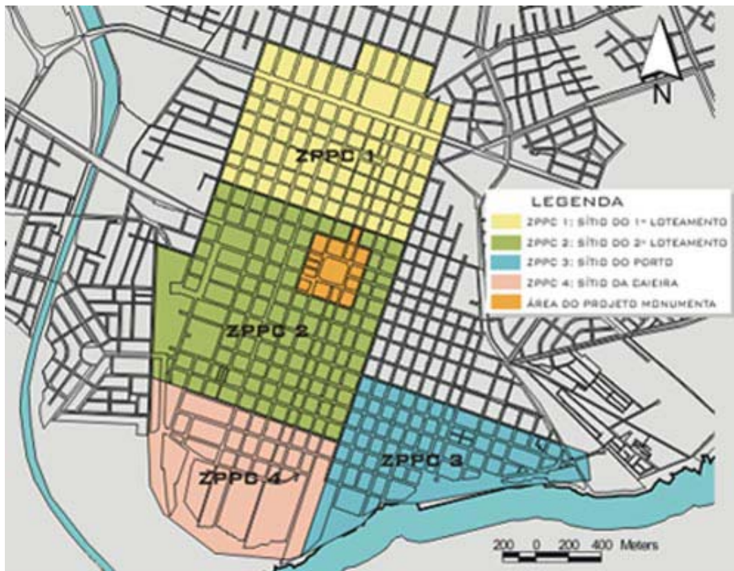
FIGURA 6 - Mapa com a delimitação das Zonas de Preservação – ZPPCs, área de maior concentração dos prédios históricos de Pelotas.