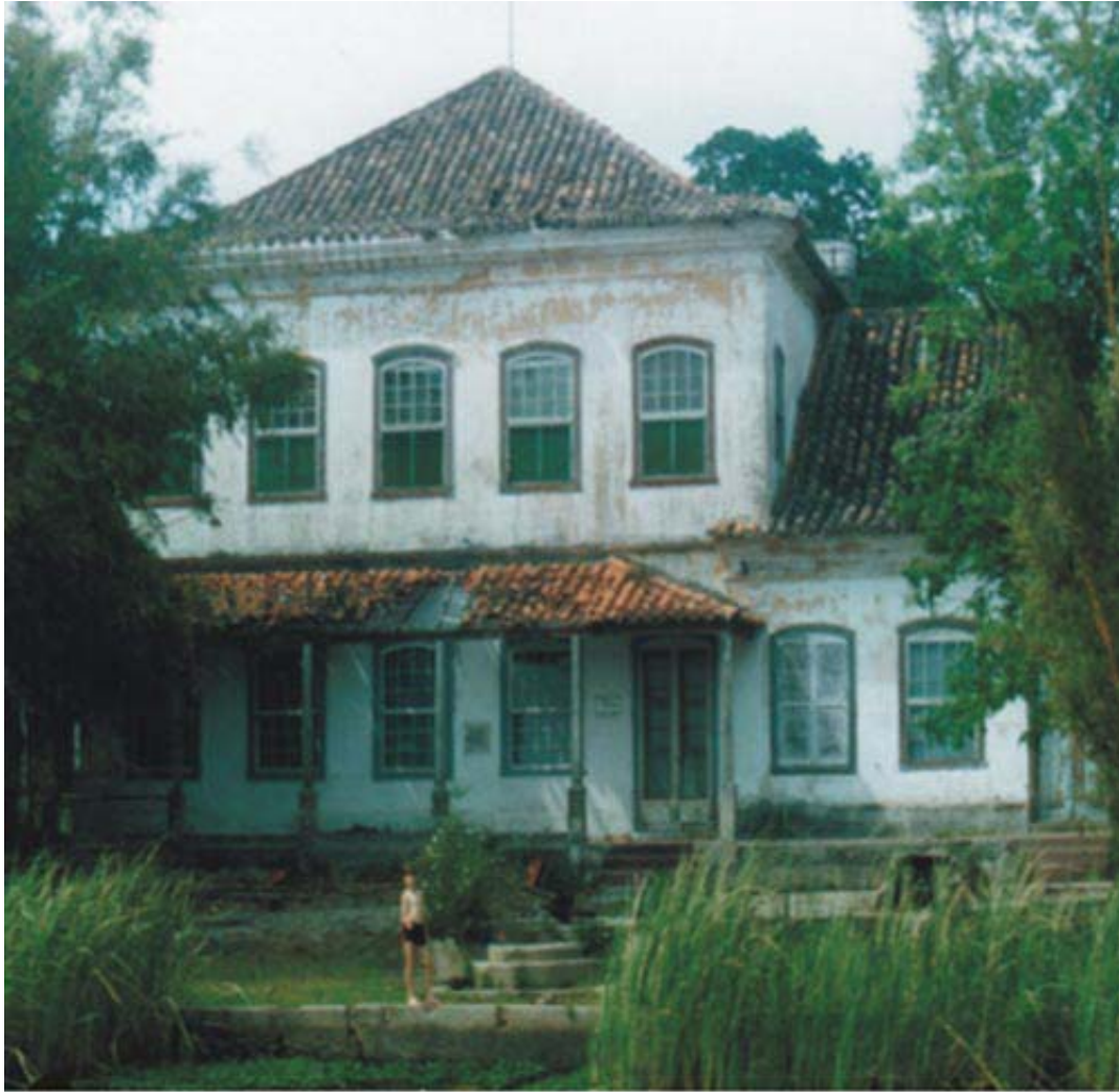
FIGURA 3 - Imagem da Charqueada do Barão de Jarau a partir das margens do Arroio Pelotas.