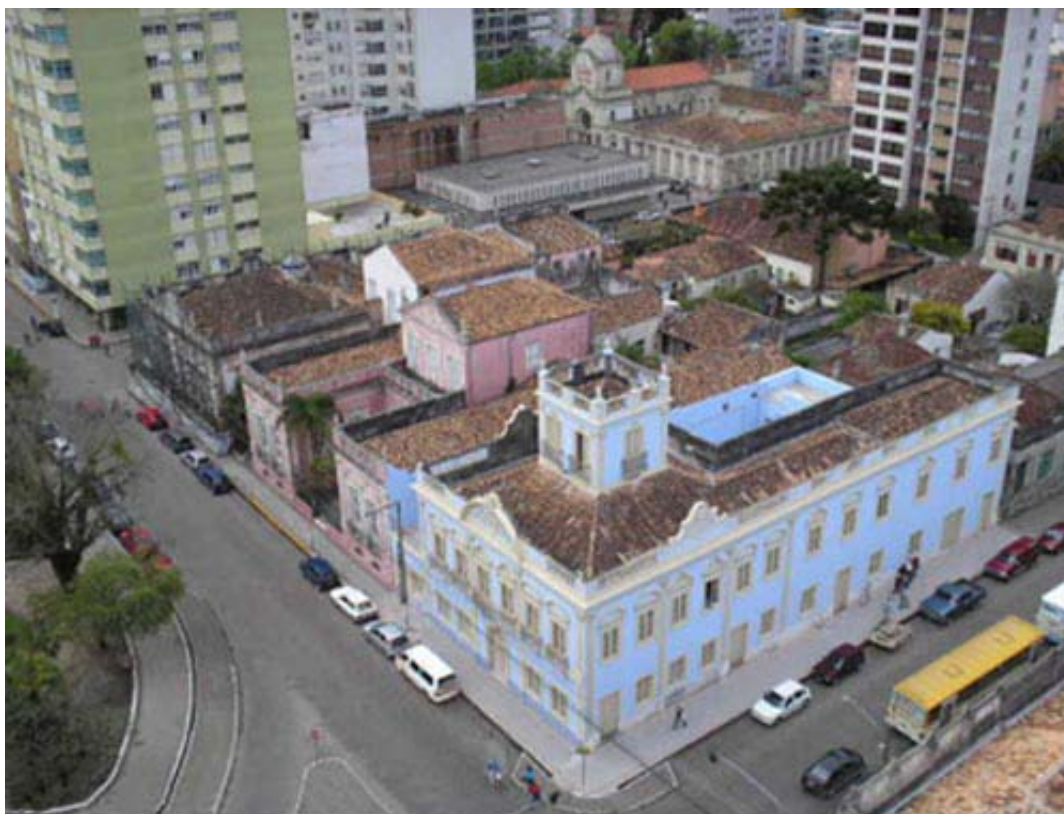
FIGURA 4 - Casarões nº 02, 06 e 08 situados à Praça Coronel Pedro Osório, conjunto eclético tombado pelo IPHAN com registro no livro das Belas Artes insc. nº 526 de 15/12/1977 e no livro Arqueológico Etnográfico e Paisagístico insc. nº 070 de 15/12/1977.