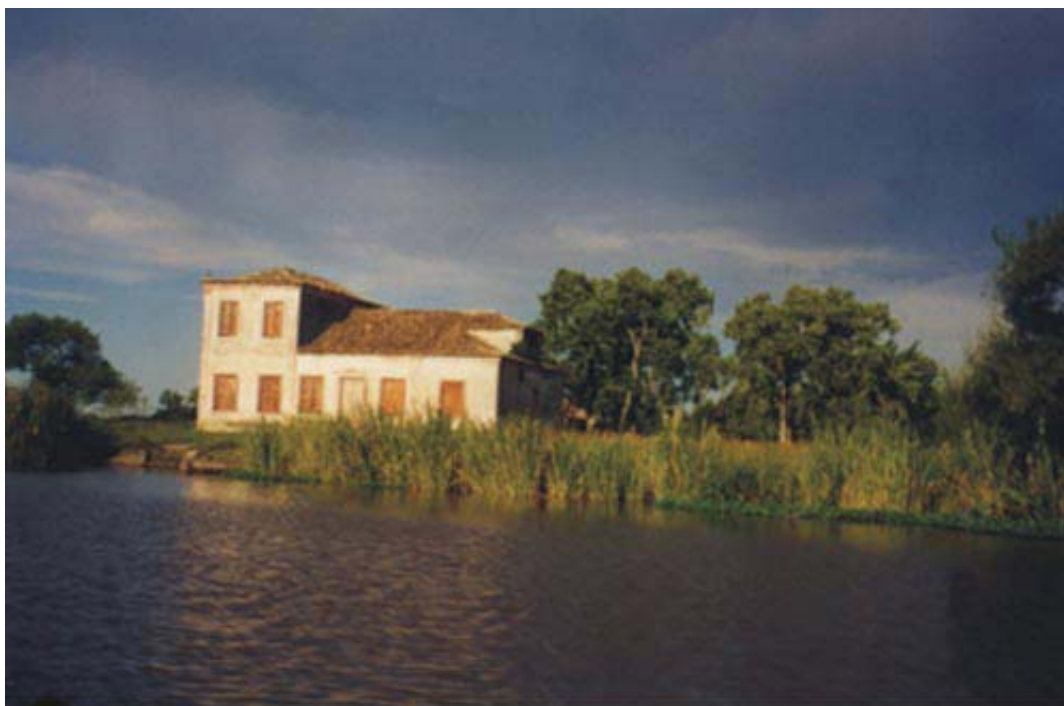
FIGURA 2 - Arroio Pelotas, área reconhecida como Patrimônio Cultural do Estado do Rio Grande do Sul através da Lei 11895/2003, com vista para a Charqueada do Barão de Butuí.