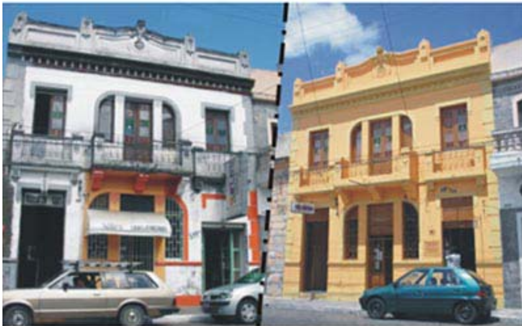
FIGURA 8 - Imóveis inventariados que aderiram ao processo de recuperação do prédio a partir da isenção de IPTU, verifica-se a adequação de pintura e aparato publicitário. Acima, na rua Félix da Cunha, 955, o edifício em 2002 (esquerda) e em 2004 (direita). Abaixo, a transformação do imóvel 514 da rua Quinze de Novembro, numa foto de 2004 (esquerda) e outra de 2005 (direita).