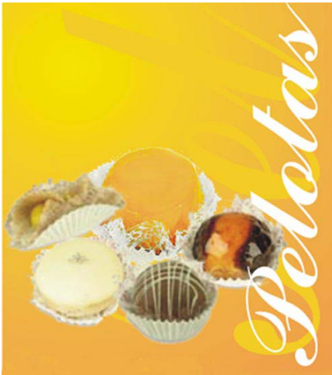
FIGURA 10 - Doces Tradicionais de Pelotas, referência cultural do município em processo de Inventário de Bens imateriais, através do projeto aprovado via Programa Monumenta.