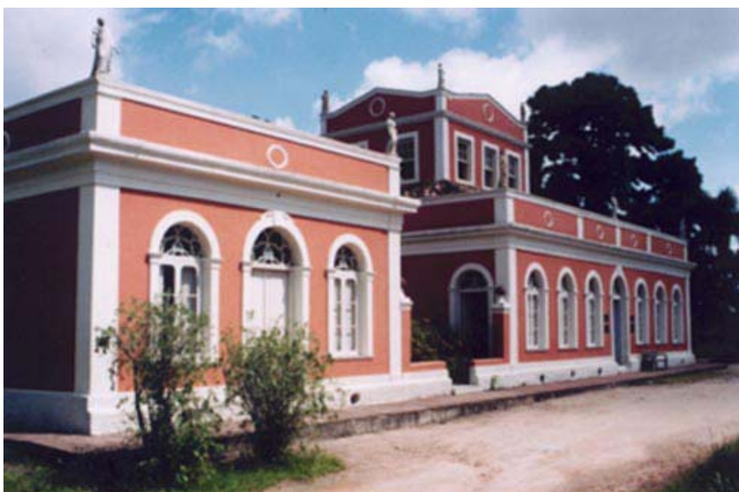
FIGURA 5 - Solar da Baronesa, bem tombado em nível municipal, implantado em extensa área verde, atualmente parque e museu municipal.