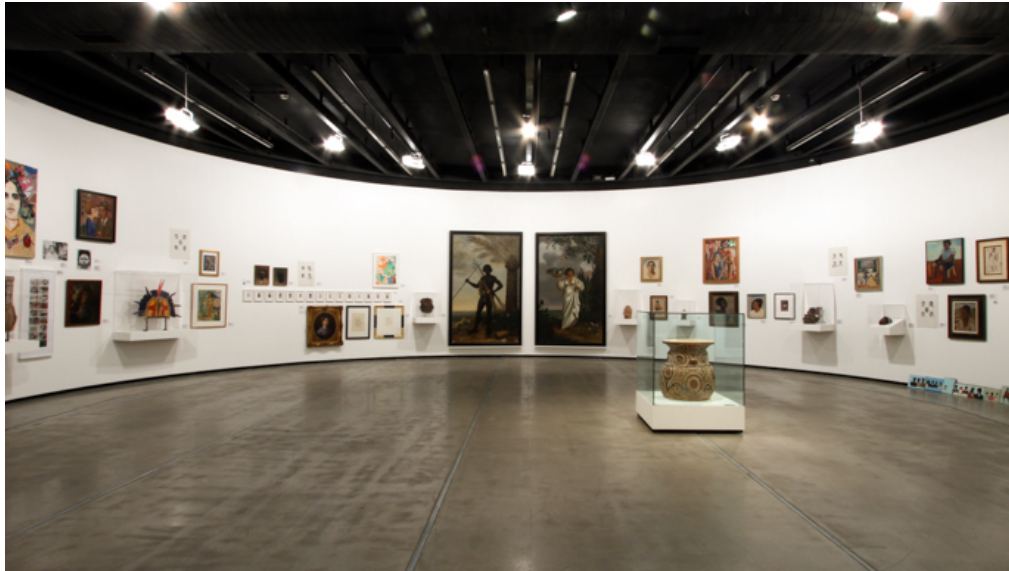
Figura 4. Histórias Mestiças. Instituto Tomie Ohtake, 2014.

juízos de gosto de uma determinada classe, e muitas vezes com a inclusão de objetos oriundos de colônias.