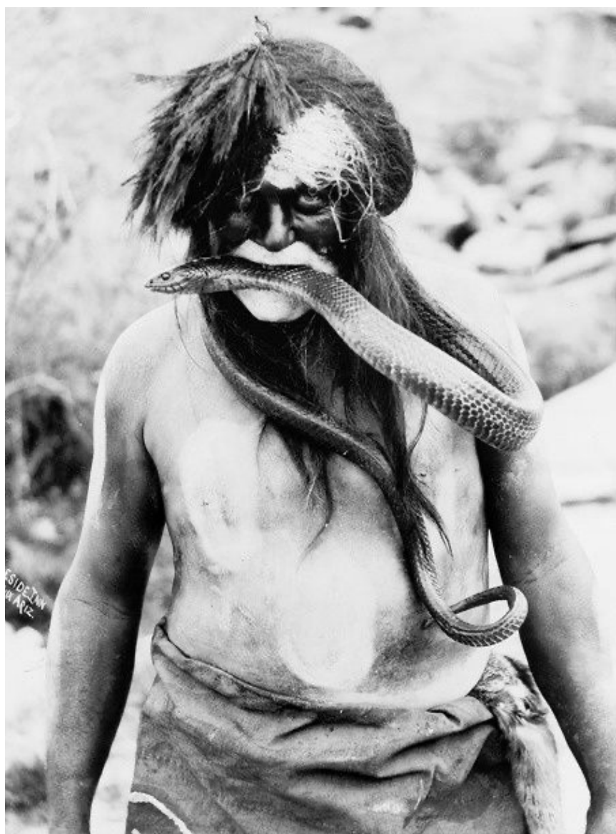
Figura 2. Anônimo norte-americano, Índio hopi durante o ritual da serpente, 1924.

mentos. Warburg percebeu a sobrevivência da simbologia acerca da morte e da ressurreição evocada pelo ritual da serpente, que havia chamado sua atenção no contato com os nativos, na Idade Média e no Renascimento, não como mera recorrência iconográfica, mas como esquema ou forma simbólica. Anos mais tarde, Warburg diria que naquele momento ele começara a sentir aversão à história de arte estetizante e à consideração meramente formal das imagens. Em 1924 retomou os croquis e fotografias realizados na América do Norte e elaborou as conferências sobre os índios Pueblo.