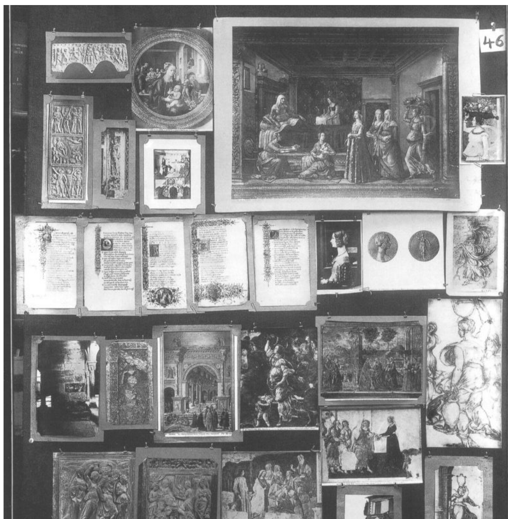
Figura 1. Aby Warburg, Atlas de imagens Mnemosyne , prancha 46. Londres, Arquivo do Instituto Warburg.

recusou a organizá-las segundo alguma hierarquia ou linearidade, optando por deixá-las pulsar em todas as direções ao mesmo tempo, conectando-se lateralmente umas com as outras.