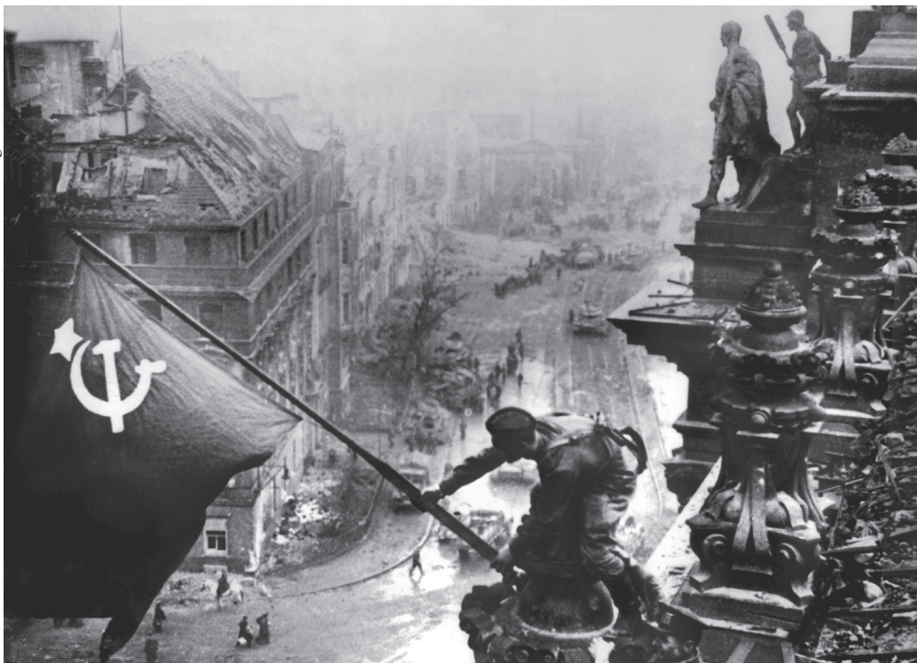
Os russos ocupam Berlim em 2 de maio de 1945: soldado levanta a bandeira sobre o Reichstag.

estréia de Mãe Coragem em janeiro de 1949 em Berlim é apenas o exemplo mais destacado, Brecht desfrutava de privilégios que não estavam disponíveis para a maioria dos intelectuais da Alemanha Oriental – incluindo, no final, um carro, duas casas e liberdade para viajar para fora da RDA. Ele também se precavou, e manteve seu status de mercadoria, garantindo para si um passaporte austríaco, uma conta em um banco suíço e um editor na Alemanha Ocidental. Assim, ele tinha um grau de independência que poucos outros possuíam. Entretanto, nem essas vantagens nem sua filiação à Academia das Artes proporcionaram a Brecht plena liberdade na RDA. Por exemplo, somente em 1954 sua companhia de teatro pôde ter uma sede fixa, o Theater am Schiffbauerdamm. Além disso, estava sempre à mercê da elite do partido para conseguir financiamentos estatais, distribuição de ingressos e resenhas de suas peças nos jornais do partido.