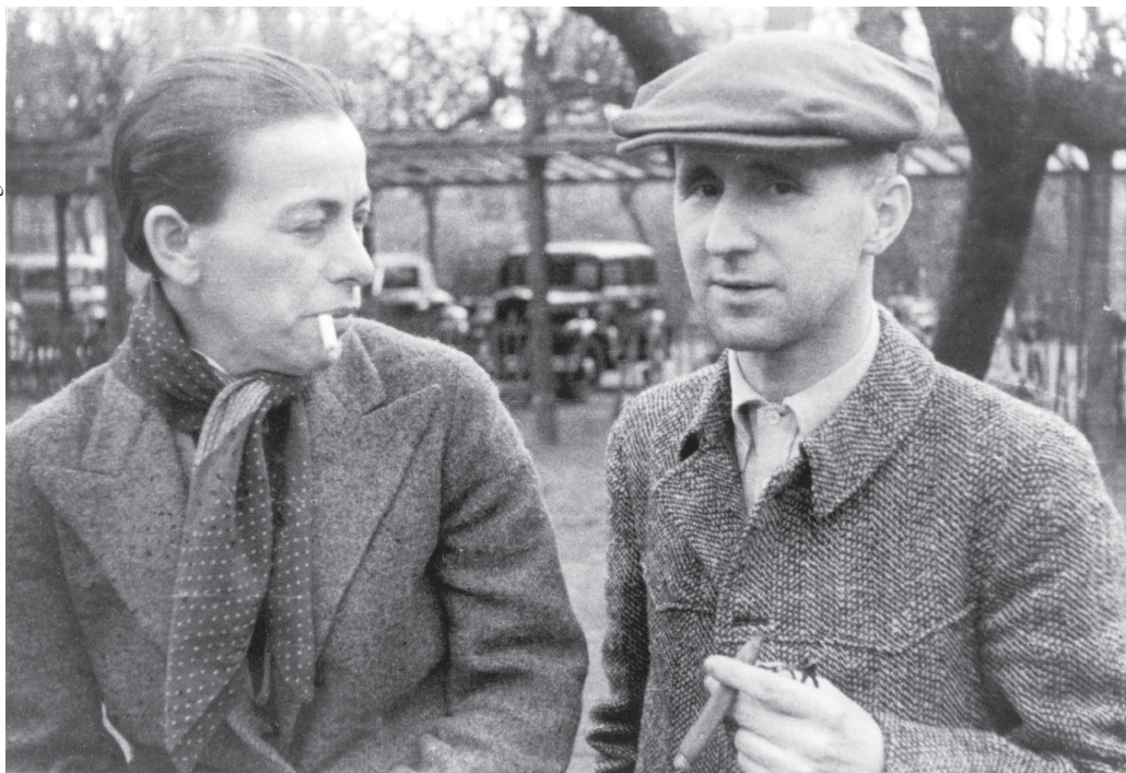
Brecht com sua esposa, a atriz alemã Helene Weigel, em Copenhague, Dinamarca, em 1936.