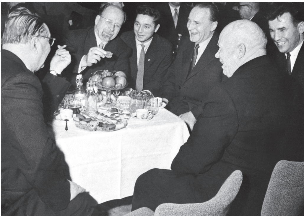
Da esq.: Ferenc Munnich, presidente do Conselho de Estado da Hungria; Walter Ulbricht, primeiro-secretário do Partido Socialista Unificado da Alemanha (SED); Janos Kadar, primeiro-secretário do Partido Comunista Húngaro; Nikita Khrushchev, presidente da União Soviética, durante o 7º Congresso do Partido Comunista da Hungria, em Budapeste, em 1959.

cultura genuinamente socialista pudesse surgir. Começando no verão de 1952, o regime de Ulbricht vinha tentando acelerar a transformação da RDA na direção do socialismo, e esperava-se a adesão da elite cultural. 26 Não haveria mais nem mesmo uma liberdade artística limitada. Em fevereiro e março de 1953, Hanns Eisler e Brecht foram atacados em virtude de seu tratamento do tema de Fausto. Objeto de discussão tanto na Alemanha Oriental quanto na Ocidental, especialmente após a celebração do bicentenário de Goethe, o tema de Fausto foi diretamente ligado à tentativa de encontrar uma tradição cultural utilizável. A figura de Fausto proporcionou a Brecht, dessa forma, a oportunidade de lidar com dois dos seus temas mais importantes durante o período pós-guerra: a tradição cultural burguesa e o relacionamento entre os intelectuais e a sociedade.