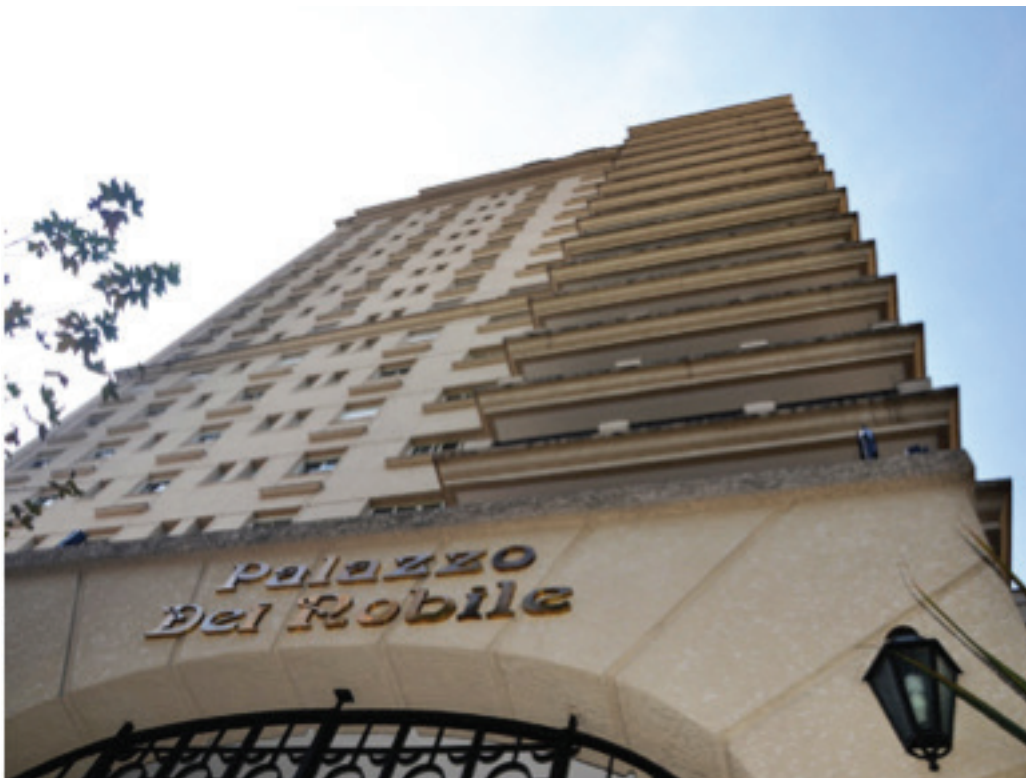
Foto do Edifício Palazzo Dei Nobile , da Construtora Kauffman, no Itaim. 6

[...] a pessoa precisa chegar e falar “uau, que bacana” [...]; então sempre eu procuro fazer uma coisa mais monumental para atender à função da monumentalidade, para eu conseguir esse... no fundo é um status para as pessoas que moram [...], uma imponência, porque eu acho que isso no fundo é uma coisa que as pessoas gostam. (Entrevista realizada em 22.6.2012)