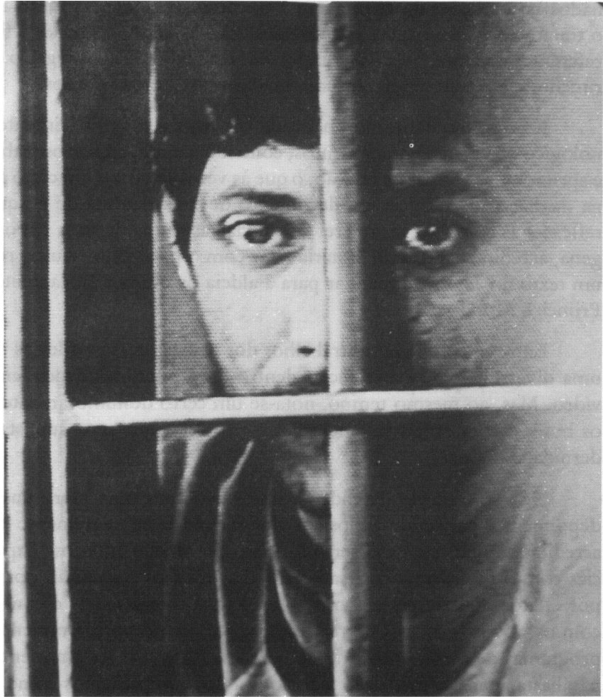
Cena extraída do vídeo Tereza