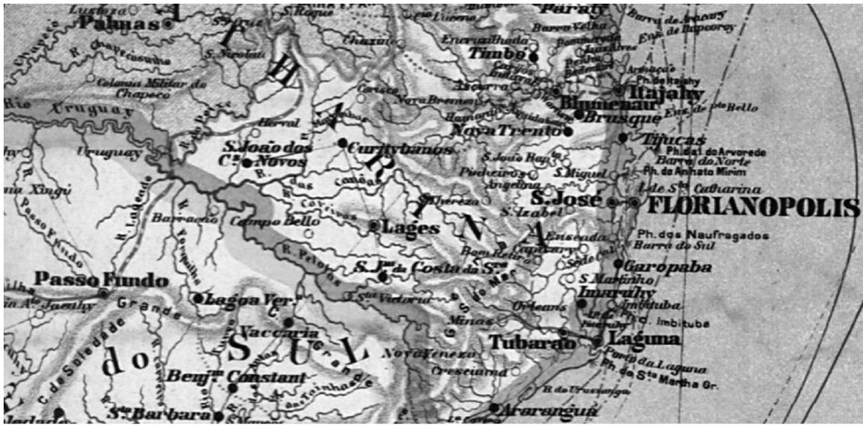
Mapa 2 - Mapa de Santa Catarina em 1908