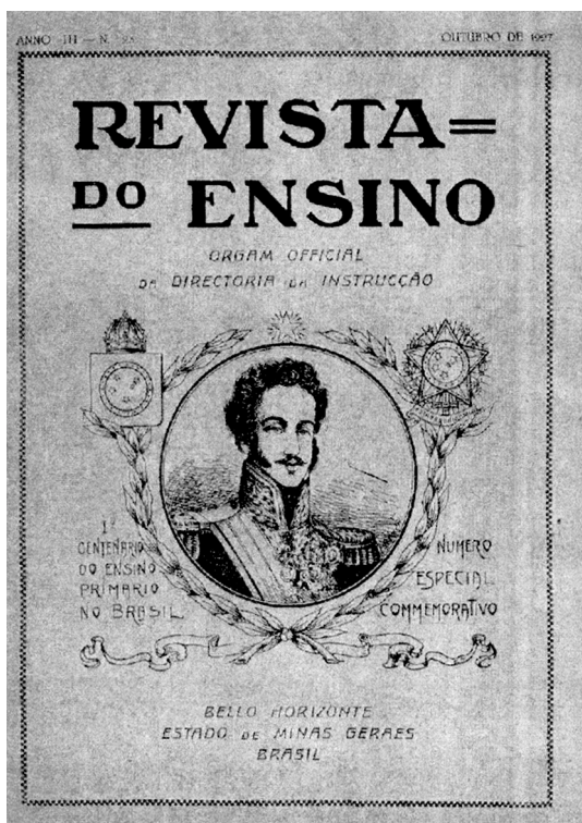
Revista do Ensino, Anno III - n. 23, outubro de 1927

notar que unindo os símbolos do Império e da República encontra-se um galho/ramo de café que, sustentando e partindo dos respectivos símbolos, formam um laço bem abaixo do retrato. Na parte de baixo da capa, vem a identificação do local de sua publicação: Belo Horizonte, Estado de Minas Gerais, Brasil.