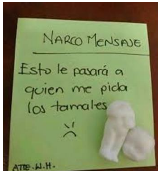
Figura 3: “Narcomensaje” de la festividad de Reyes-Candelaria.