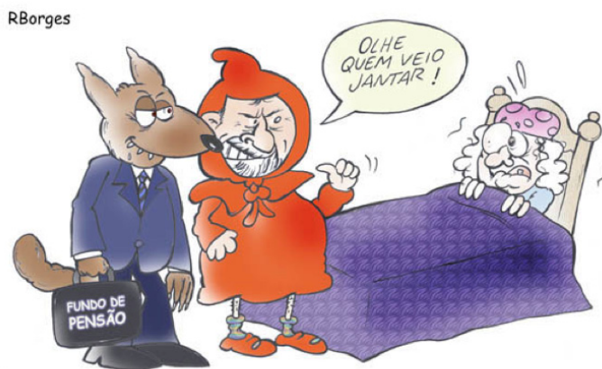
Figura 1 – Borges, R. Haja Humor! Andes – SN, 2008

Tendo como base essa proposta de Pêcheux, analisemos uma charge enfatizando os elementos constitutivos de suas condições de produção e os efeitos de sentido produzidos, na tentativa de exemplificar, juntamente com as análises de Nascimento (2011) já referidas anteriormente, como a Análise do Discurso pode ser inserida no contexto escolar com atividades de leitura e de escrita, por exemplo: