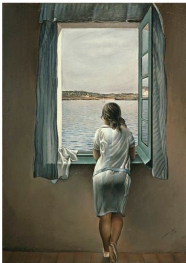
Figura 3 – Dalí S. Moça à janela, 1925 10 .

Tendo em vista que a internet mescla os papéis de produtores e consumidores em um só sujeito, demonstraremos a seguir de que maneira isso ocorre por meio da ressignificação de uma pintura espanhola. Consideremos, portanto, a Figura 2: é uma paródia (construída por meio da manipulação imagética) do quadro “Moça à janela”, do pintor Salvador Dalí. Originalmente, a moça encontrava-se diante de uma paisagem em que se via somente o mar, um pedaço de terra e o céu. Nessa paródia – realizada por Jherlyn López, intitulada “Muchacha ante central térmica”, disponível no site Consume Hasta Morir e extraída de um conjunto de imagens que têm por objetivo realizar uma crítica ao consumismo – percebemos efeitos de trucagem típicos do gênero fotográfico, porém, na internet, essa técnica também se estende a qualquer tipo de imagem. Na manipulação, a moça encontra-se diante de uma central térmica. As usinas termelétricas, como sabemos, são instalações industriais usadas para geração de eletricidade a partir da energia liberada