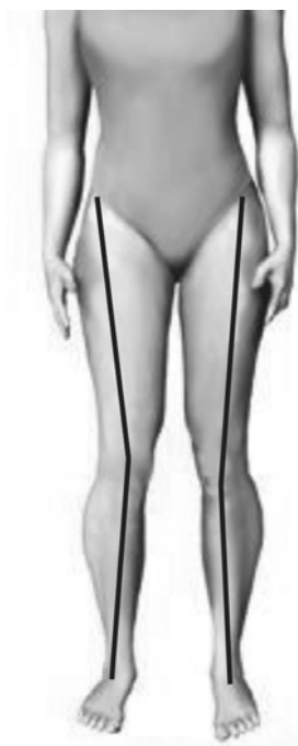
Figura 1 Ilustração da mensuração do ângulo frontal do joelho

considerada por Norkin e Levangie 18 como o centro articular do joelho e comumente visualizada por meio de exame radiográfico, não poderia ser estimada diretamente por imagens fotográficas.