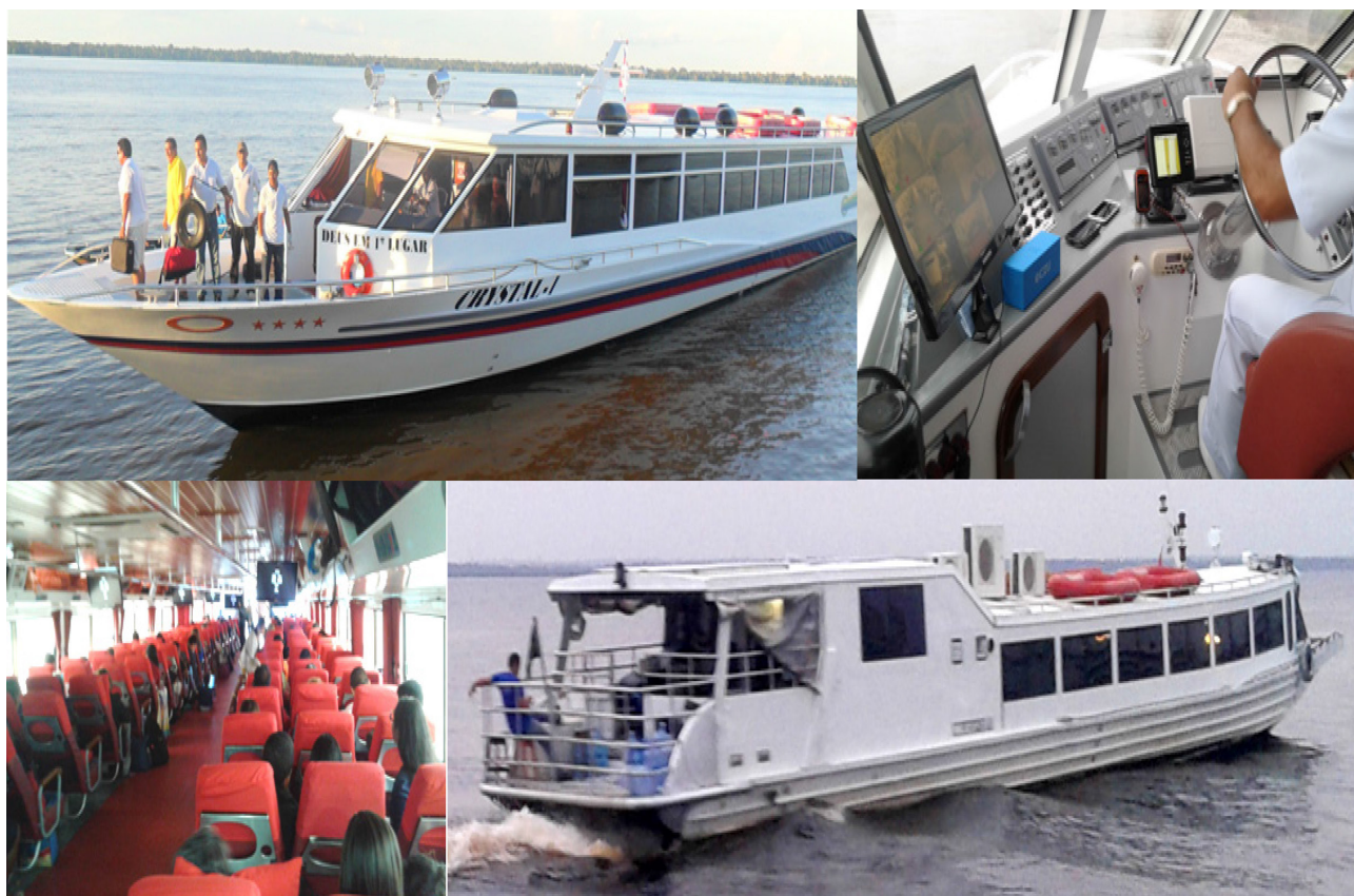
Figura 1 – As lanchas Ajato do rio Solimões

Essas embarcações versáteis e potentes são resultado de uma modernização dos objetos da circulação regional amazônica. Concorrem com os outros tipos de embarcação do transporte regional de passageiros como os navios-motores (N/M) e os ferry-boats (F/B), chegando a influenciar a demanda da circulação pertinente ao transporte aéreo. Acabam por atender as necessidades do cotidiano e a expansão de novas técnicas provenientes de uma divisão territorial do trabalho inerente a espaços luminosos. Isto proporciona uma dialética do território, “o confronto dialogado entre o velho e novo, o local e o global, as verticalidades e as horizontalidades” (Silveira, M. L., 1999, p. 400).