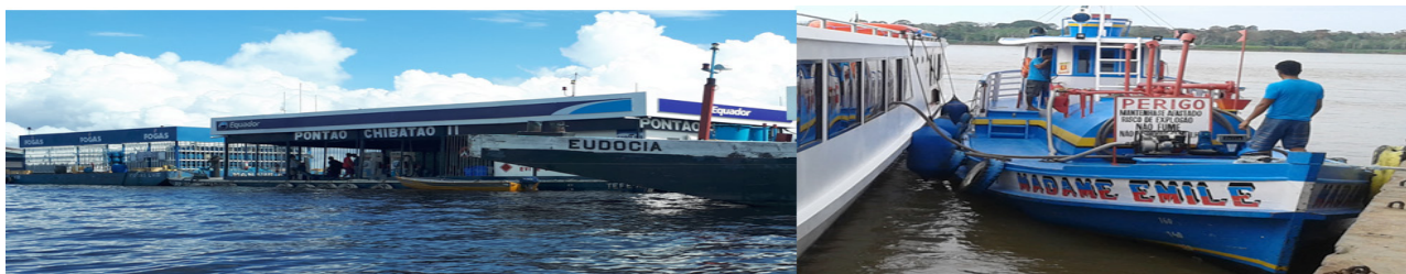
Figura 6 – Um dos pontões do lago de Tefé (à esquerda) e o barco de madeira que abastece as lanchas em Santo Antônio do Içá (à direita) no Alto Solimões

Sendo assim, os fixos especializados ao transporte fluvial no Solimões atendem de maneira restrita e limitada as operações de barcos modernos como as lanchas Ajato, que devem sua operacionalidade aos Pontões, flutuantes e barcos detentores de equipamentos antigos e técnicas envelhecidas, mas úteis para a fluidez da circulação regional nestes espaços distantes (Figura 6).