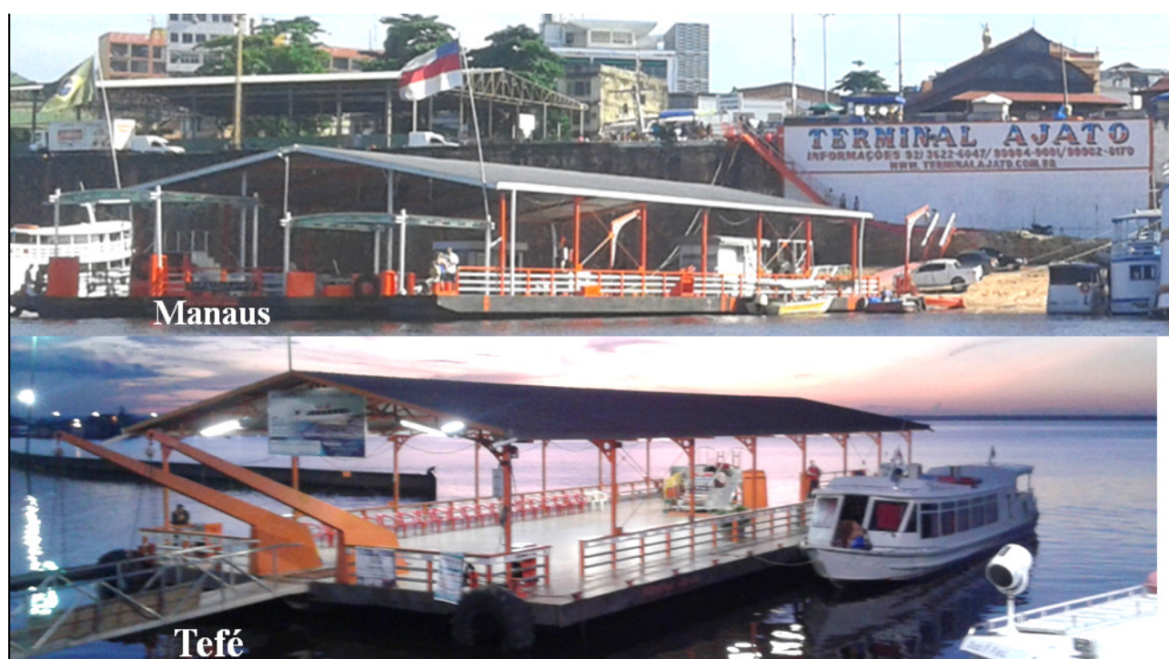
Figura 5 – Os terminais das lanchas Ajato, de Manaus (acima) e de Tefé (abaixo)

O sr. Aguiar atua como consultor de empresas novas que estão construindo suas lanchas para ingressar no mercado da navegação amazônica, inclusive fazendo sugestões às estruturas dos F/B, que concorrem diretamente com os fluxos dos N/M no Amazonas. A empresa Ajato socializa com outras empresas parceiras do ramo as estruturas de seus terminais e de seus serviços como o terminal de passageiros em Manaus e Tefé (Figura 5).