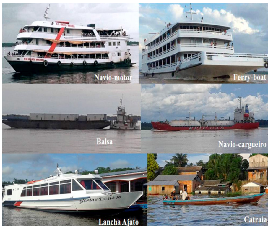
Figura 3 – Principais embarcações do rio Solimões

as estruturas do porto, e, finalmente, (vi) as pequenas catraias que ainda são importantíssimas para a comunicação e integração das comunidades mais isoladas e carentes tanto do Solimões como de seus diversos afluentes e sub-afluentes; são canoas com motores de popa tipo rabeta, levam grande parte da produção agrícola de subsistência dos caboclos, base da economia do interior do Amazonas (Figura 3). Os botes de alumínio com motor de popa são as “voadeiras”.