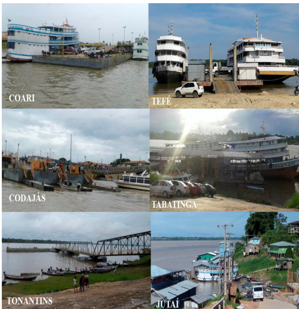
Figura 4 – Instalações portuárias públicas de pequeno porte (IP4) de Coari, Codajás e Tonantins (à esquerda) e as instalações portuárias rudimentares de Tefé, Tabatinga e Jutai (à direita)

A Administração Hidroviária da Amazônia Ocidental (Ahimoc) 5 providencia as demandas acolhidas pelo Dnit nos portos das cidades do Solimões que têm IP4. Em sua jurisdição geográfica, compete a essa administração “desenvolver atividades de execução e acompanhamento de estudos, obras, serviços e exploração das vias navegáveis interiores, bem como dos portos fluviais e lacustres que lhe sejam atribuídos pelo Dnit” (CNT, 2013, p. 37). Nos municípios que têm portos IP4, há licitações para que empresas terceirizem a administração, os serviços de vigilância e a manutenção da operacionalidade (Figura 4).