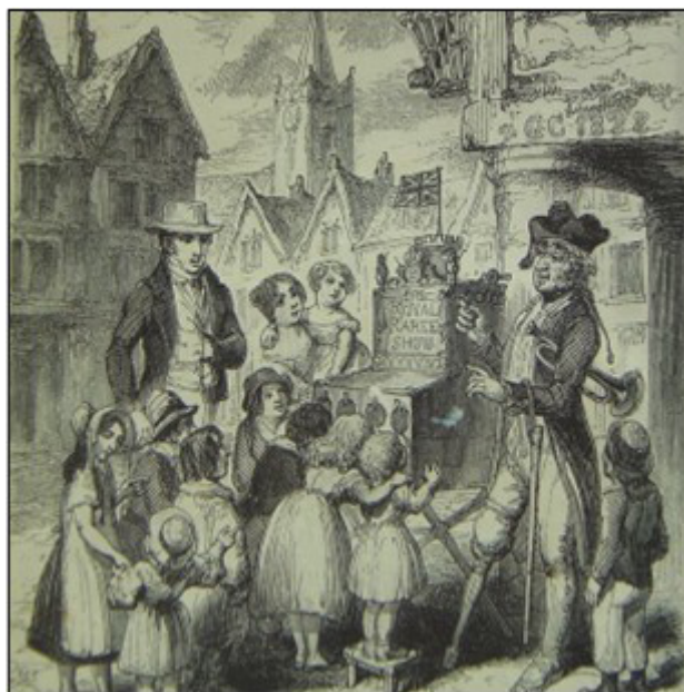
Figura 1 – Os apresentadores de raridades eram andarilhos que cobravam para que as pessoas pudessem ver imagens e objetos incomuns num tempo em que viajar longas distâncias era muito restrito

A diversidade é o apanágio do espaço geográfico, e sabe-se que a curiosidade do homem por paisagens e lugares remonta aos primórdios da vida em sociedade e é um importante molde e progresso da geografia (Lewis, 1985; Phillips, 2010). A curiosidade substanciou a chamada geographie de plein vent , 17 que, mesmo proporcionando às pessoas um misto importante de sentimentos, evidenciou o triunfo da curiosidade sobre o medo do desconhecido. O apresentador de raridades (do inglês, raree-showman ) foi uma figura que sintetiza o desejo do homem de conhecer as possibilidades do habitar e do contemplar (Plunkett, 2015). Eram andarilhos que vagavam pelo continente europeu com grandes caixas de madeira que traziam furos pelos quais as lentes de lupas estavam acopladas (Figura 1). Entre outras atrações, por esses furos era possível ver ilustrações de paisagens e lugares, bem como artefatos produzidos por povos distantes. Veronica Della Dora (2009) afirma que na contemporaneidade continuamos a ver o mundo em caixas: televisores, computadores e diversos outros dispositivos eletrônicos que nos permitem acessar imagens de locais distantes e não familiares. É preciso considerar que, no conjunto das relações do homem com o espaço, as emoções ocupam posição de destaque. É sempre importante abordar a perspectiva emocional nas reflexões sobre a paisagem e o lugar.