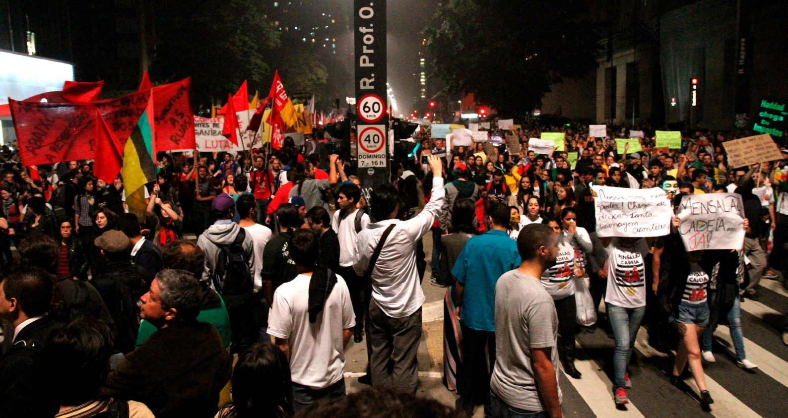
FIGURA 1 [São Paulo, 2013].

Este ensaio explora certa configuração estético-política presente na fotografia de uma manifestação do dia 20 de junho de 2013, na Avenida Paulista, em São Paulo (Figura 1).