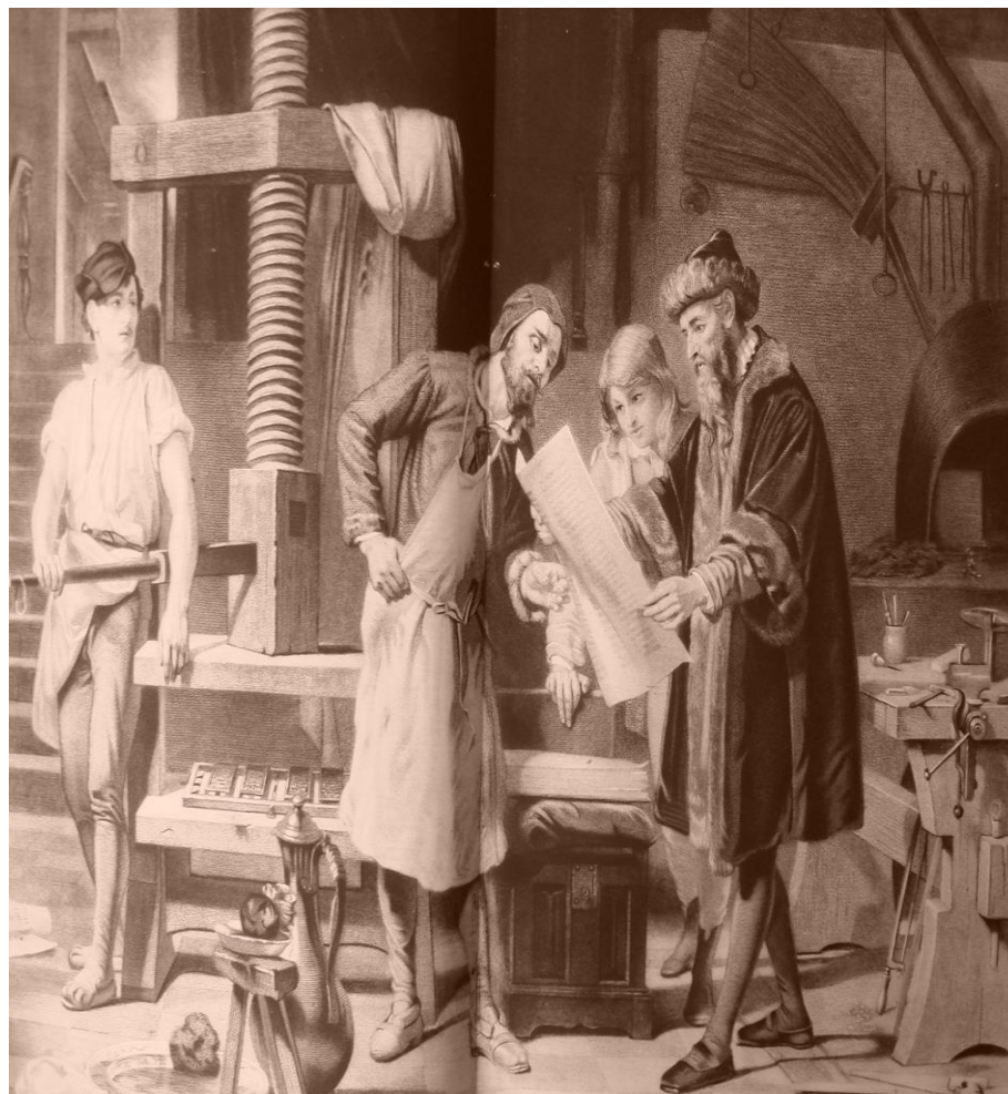
FIGURA 1 – Gutenberg e a Tipografia

Gutenberg faz sua primeira prova tipográfica. Heliogravura da antiga estampa gravada por Aug. Ledoux, impressa por Alfred Chardon e editada por Dusacq em Paris.