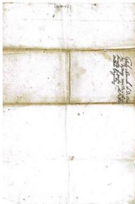
Figura 4 – Folha 02.v