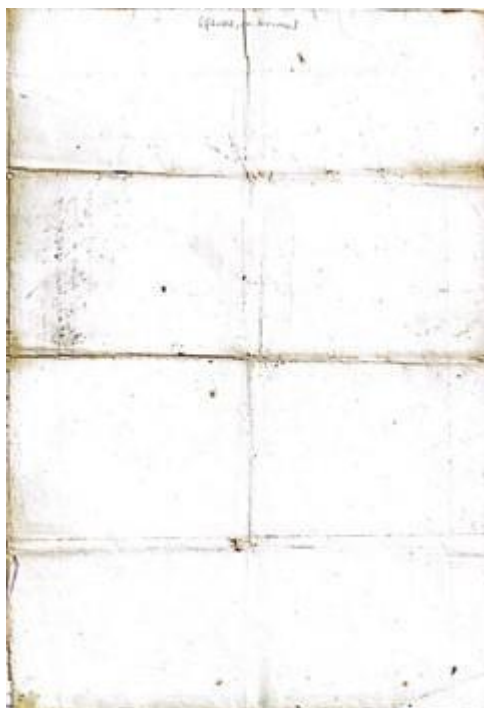
Figura 3 – Folha 02, em branco