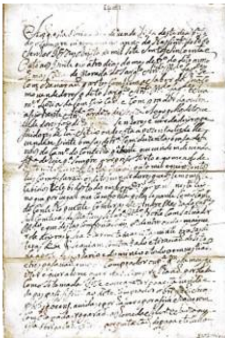
Figura 1 – Folha 01