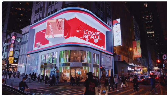
CARTIER - Love Is All DOOH 3D