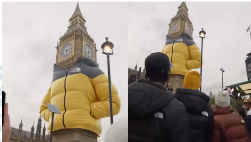
Figura 2: Ação publicitária The North Face no Big Bem. Londres, novembro de 2023