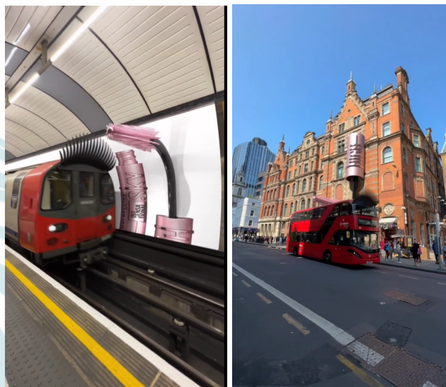
Figuras 6 e 7: Ação FOOH da Mabellyne supostamente no metrô e nas ruas de Londres (2023)