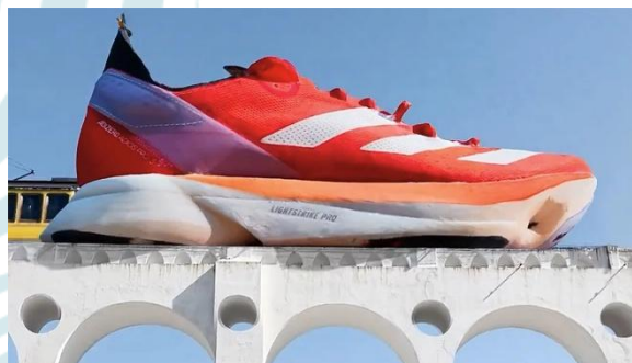
Figura 3: Tênis Adidas hiperbólico nos Arcos da Lapa, Rio de Janeiro (2023).