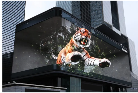
Samsung Launches "Tiger In The City" 3D DOOH Campaign