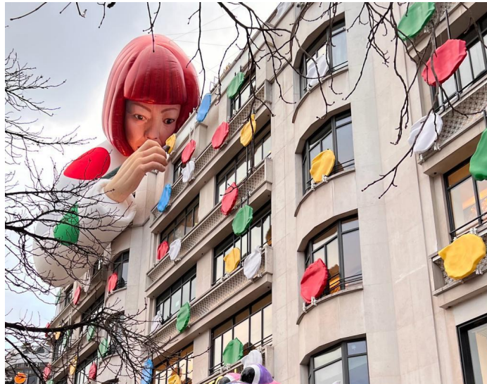
Figura 1: Ação publicitária LV e Yayoi Kusama, janeiro de 2023