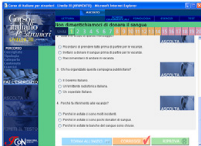
Figura 4: Italicron : tela 2, parte final da atividade de escuta