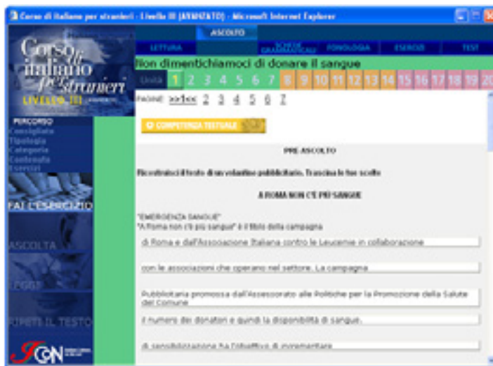
Figura 2: Italicon : atividade de pré-escuta