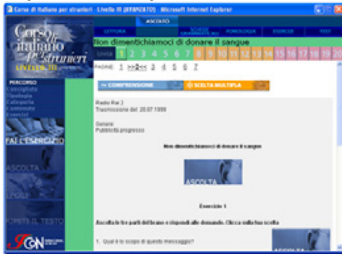
Figura 3: Italicron : tela 2, parte inicial da atividade de escuta