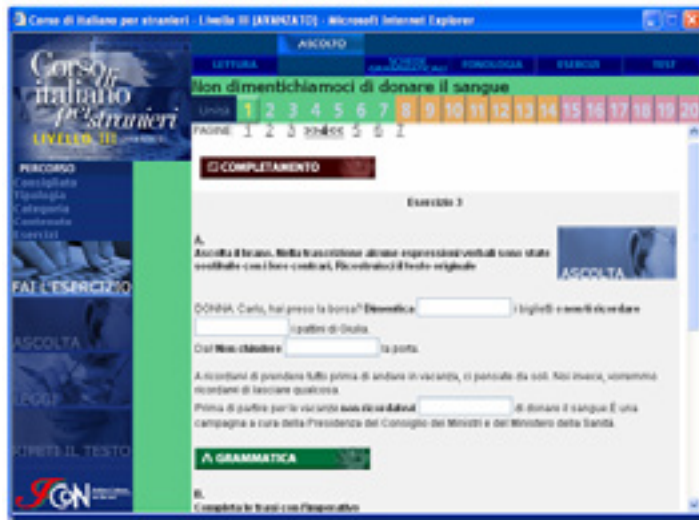
Figura 6: Italicon : atividade de escuta, preenchimento de lacunas 2