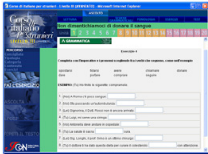
Figura 7: Italicon : atividade de pós-escuta

Por fim, as atividades de pós-e no imperativo e acrescentando os pronomes necessários.