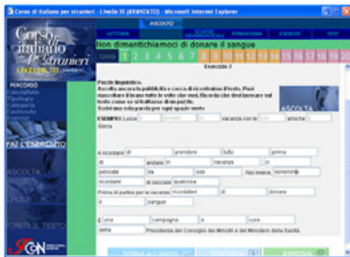
Figura 5: Italcon : tela 3, atividade de escuta

O segundo exercício propõe um preenchimento de lacunas a partir da reescuta do texto. Como podemos ver na Figura 5, não há um padrão de escolha para as palavras que devem ser preenchidas. A atividade tem como foco o reconhecimento de formas do Italiano, presentes no texto, mas também não se restringe a apenas testar se o aluno compreendeu ou não as formas. Esse cuidado está do fato de ele poder ouvir o texto quantas vezes precisar para cumprir a atividade. Notamos que, no próprio enunciado da atividade, o aluno é conscientizado sobre essa possibilidade. Na Figura 5 podemos observar a frase exata da instrução: “você pode escutar o texto quantas vezes quiser”.